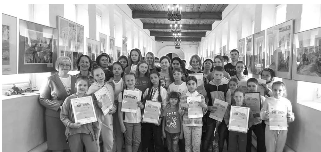
На выставке в галерее кремля Владимиро-Суздальского музея-заповедника.