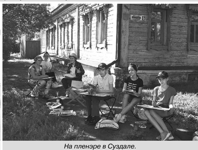
На пленэре в Суздале.