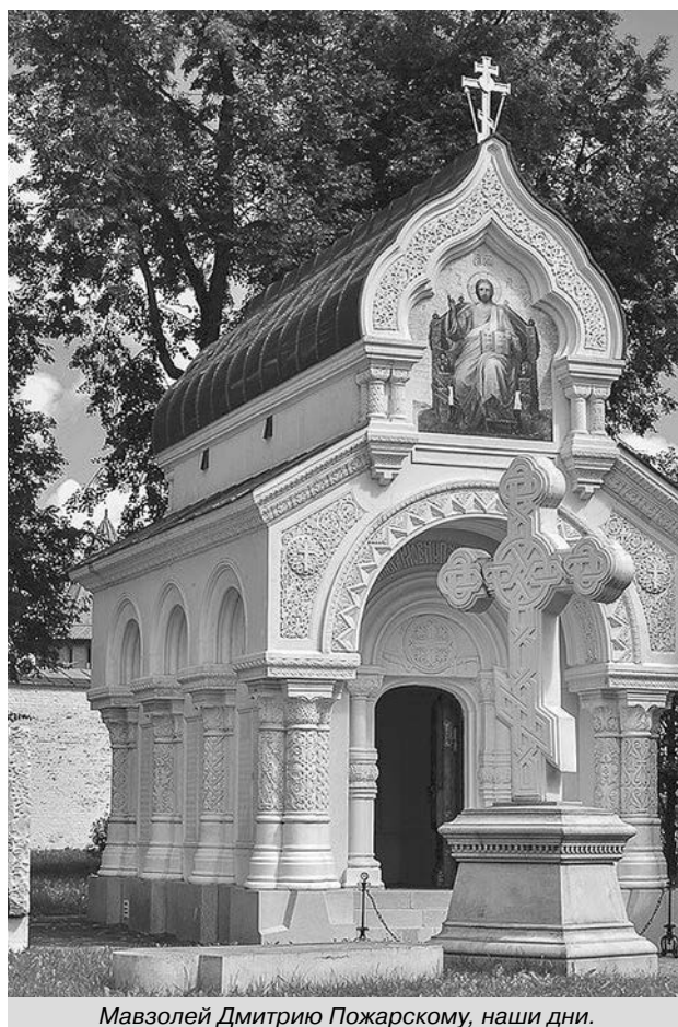
Мавзолей Дмитрию Пожарскому, наши дни.

С течением времени наметился всё больший отход от авторского проекта. Это выразилось в том, что по повелению Александра II, последовавшего в 1865 году, «...вместо предполагавшего деревянного киота сделать таковой из мрамора, так как деревянный при тонкости стен здания не может выстоять, равно как по той же причине и икону Божьей Матери вместо