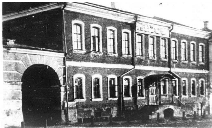
г. Суздаль, ул. Кремлевская, д.7. Здание бывшего магистрата Фото нач. XIX в.