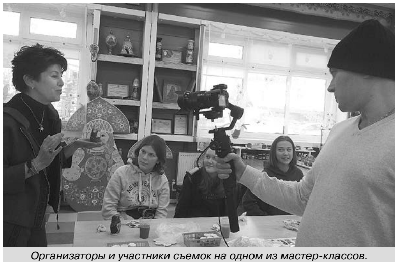
Организаторы и участники съёмок на одном из мастер-классов.

Два дня мы посвятили пред-ставлению нашего Суздаля гостям и съёмкам видео про него. Нача-ла предложение поучаствовать в съёмках видеоролика для YouTube прозвучало волни-тельно, так как у меня никогда не было опыта выступле-ния на видео. Но, когда уже начался процесс съёмки, я совсем не думала о том, что это выступление на ка-меру. У нас завязался неформальный разговор о кра-сотах нашего города, о его повседневной жизни и со-временных проблемах. Показывая гостям наши досто-примечательности, посещая сувенирные предприятия, было удивительным открывать для себя вновь все то, что является для нас привычным. Красота пейзажей,