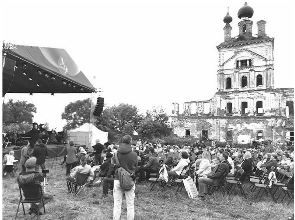
Концерт фестиваля «Музыкальная экспедиция» с успехом прошел в селе Весь.