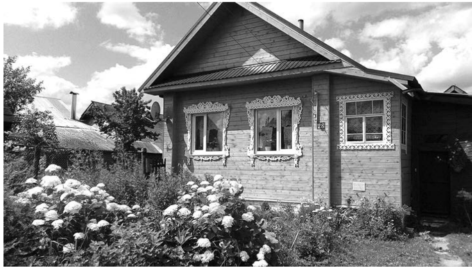
В нашем регионе очень много красивых деревень.