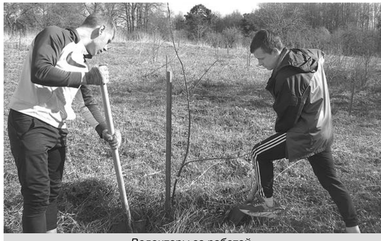
Волонтеры за работой.