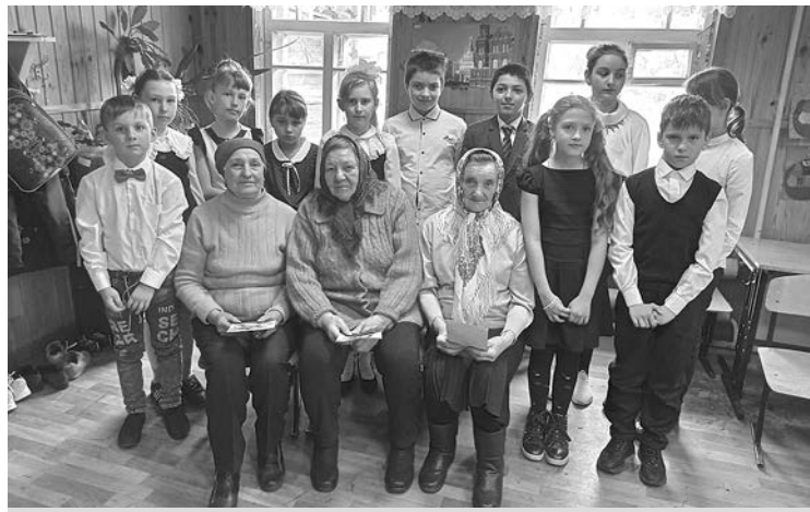
Дети с удовольствием общаются с людьми старшего поколения.

Редактор приложения: Ольга Перепелицына, зам. директора по воспитательной работе центра «Исток».