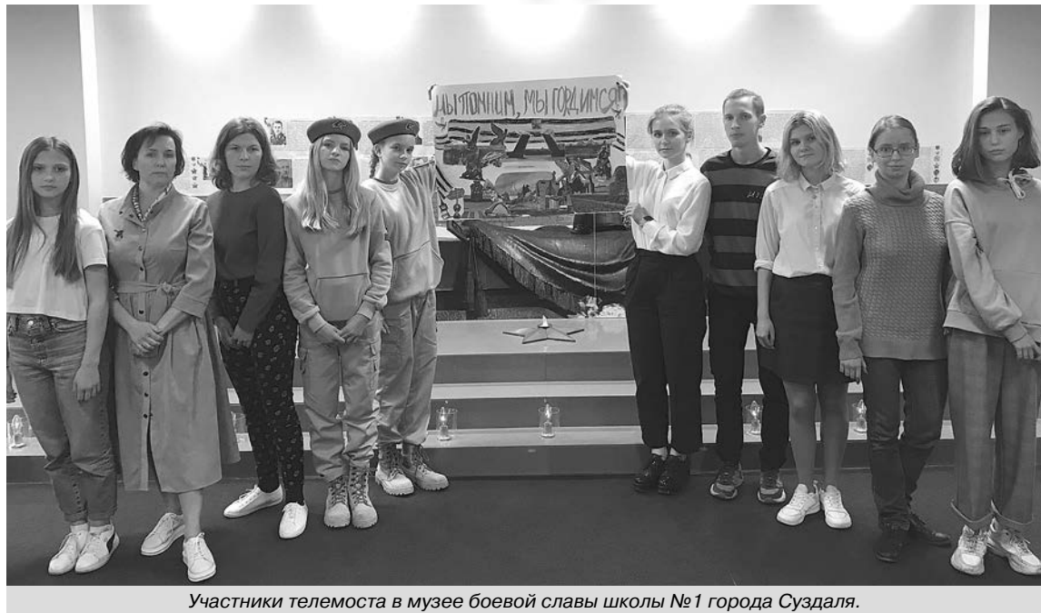
Участники телемоста в музее боевой славы школы №1 города Суздаля.