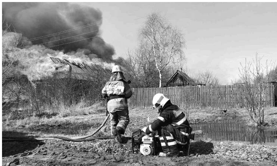
Гусь-Хрустальный район, 15 апреля 2021 года.