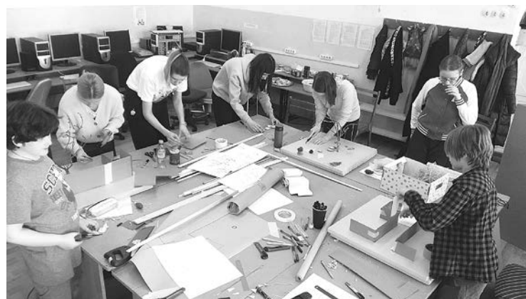
При макетировании проекта благоустройства двора центра «Исток».