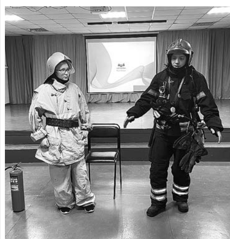
На уроке безопасности в Сновицкой школе сотрудники МЧС и РОССОЮЗСПАСа.