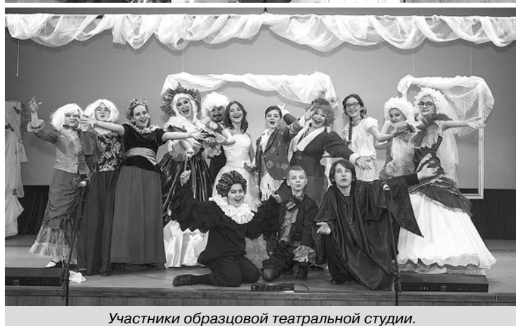
Участники образцовой театральной студии.

за это очень благодарны. Мы всег- да чувствуем ее поддержку, ценим ее уроки мастерства. Она спла- чивает наш коллектив, который очень дружный. Нас всех объеди- няет творчество. А еще очень важ- но чувствовать и видеть эмоции