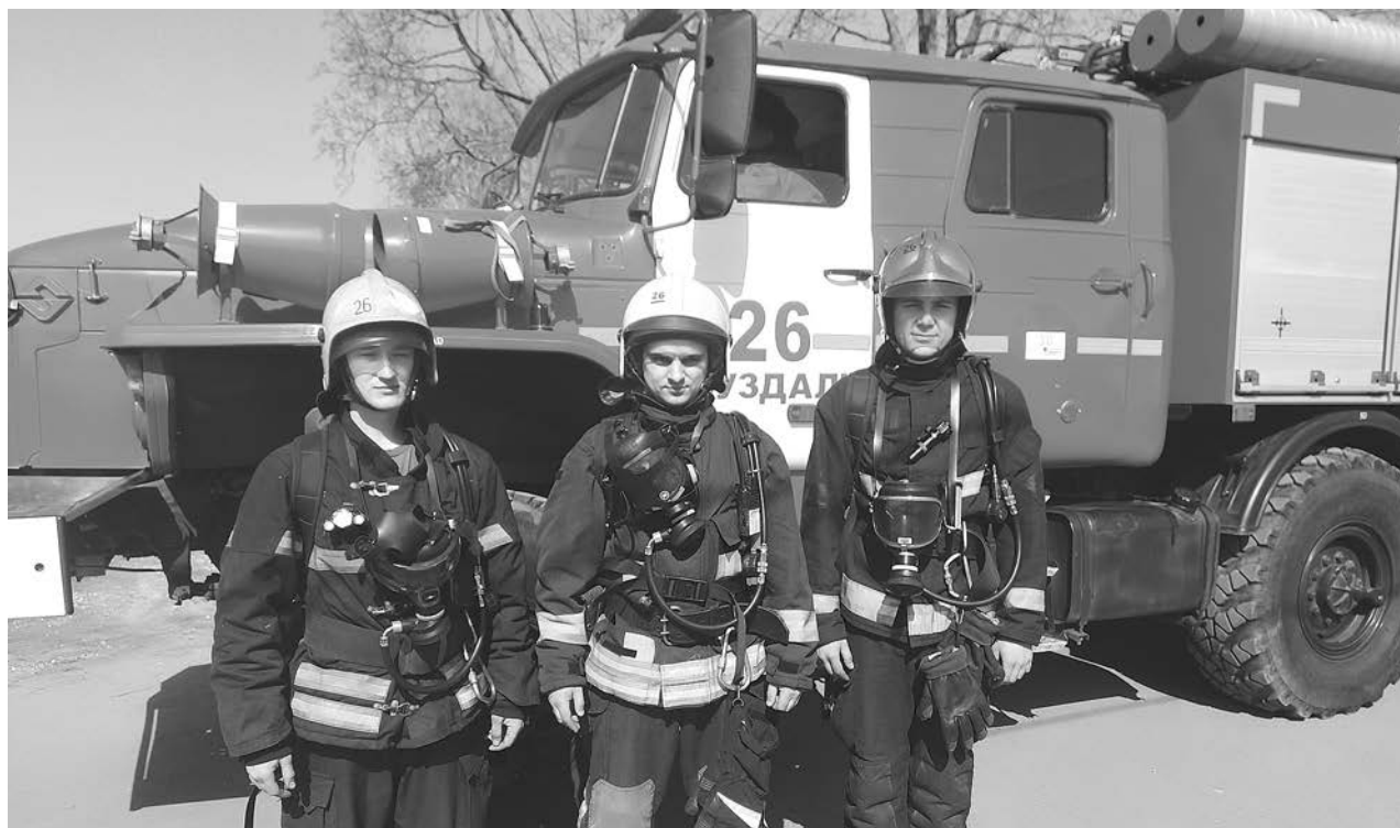
Суздальские пожарные, участвовавшие в ликвидации пожара в селе Малое Борисово и в деревне Турово.

УВАЖАЕМЫЕ ЖИТЕЛИ СУЗДАЛЬСКОГО РАЙОНА! С 12 апреля 2021 года на территории Владимирской области УСТАНОВЛЕН ПОЖАРООПАСНЫЙ СЕЗОН!