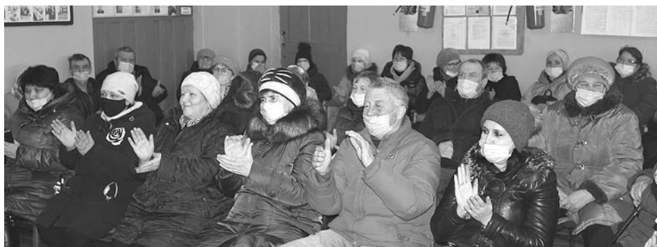
Благодарные сельские зрители.