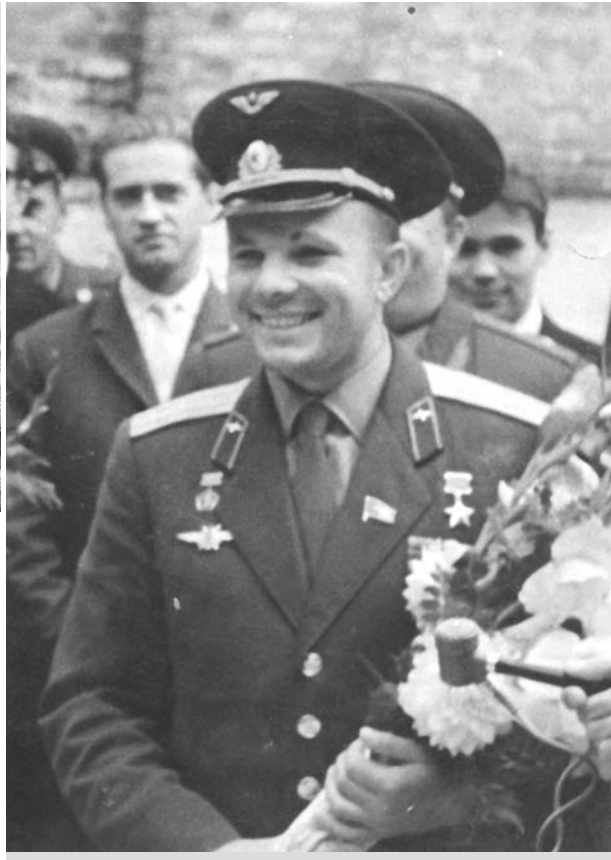
Юрий Гагарин в Суздале. 1963 г.

12 апреля 2021 года исполняется ровно 60 лет со дня первого полета человека в космос. В этот день в 1961 году с космодрома Байконур впервые стартовал космический корабль с первым в истории человечества космонавтом Юрием Гагариным на борту. За этот полет ему было присвоено звание Героя Советского Союза, а 12 апреля стало Днем космонавтики. Идею праздника предложил второй космонавт Герман Титов, в честь первого орбитального полета человека в космос.