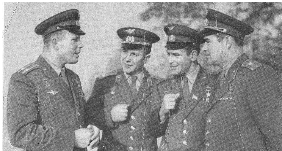
Открытка на память от первого космонавта Ю. Гагарина.

Сегодня мы публикуем интересные заметки, которые нам прислали в редакцию. Это и воспоминания о визите Гагарина в Суздаль, и рассказы о том, как проходят праздники на селе с участием наших замечательных артистов. Пользуясь случаем, мы передаем им большую благодарность от зрителей, жителей нашего района за готовность выступать в выходные, в нетопленных клубах, за радость творчества, за концерты! Дорогие артисты, вам желают новых ярких проектов, идей, творческой энергии. Пусть ваша любовь к культуре России всегда находит отклик в сердцах ваших благодарных зрителей!