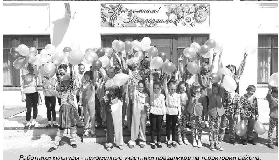
Работники культуры - неизменные участники праздников на территории района.

система» утвержден информационным Интернет-ресурсом о культуре Суздальского района. Число обращений за 2020 год составило 8937 ед.