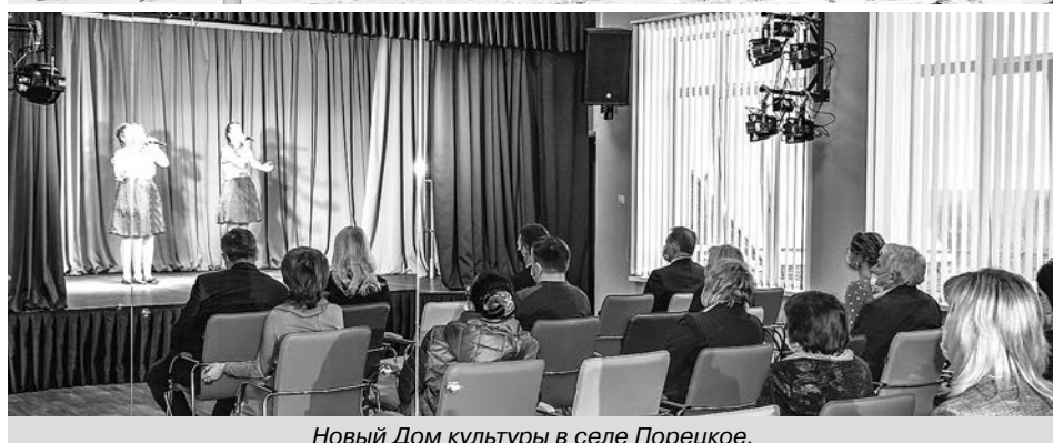
Новый Дом культуры в селе Поречское.