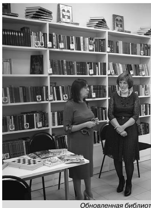
Обновленная библиотека в селе Омутское.