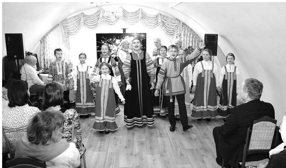
Выступает образцовый фольклорный ансамбль «Брянички».