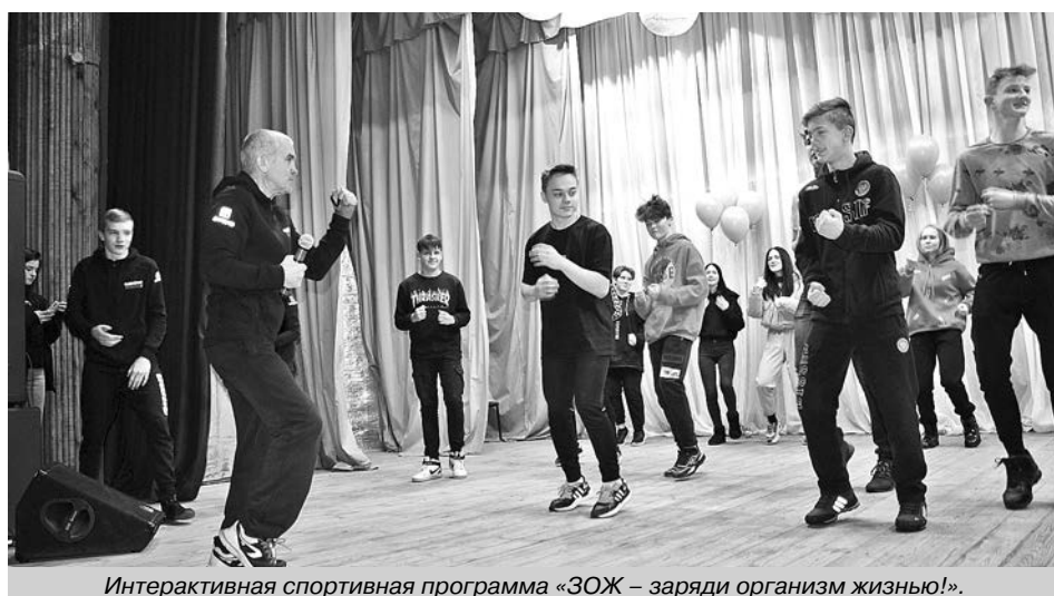
Интерактивная спортивная программа «ЗОЖ – заряди организм жизнью!».