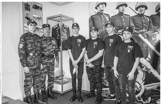
Члены отряда «Овод».