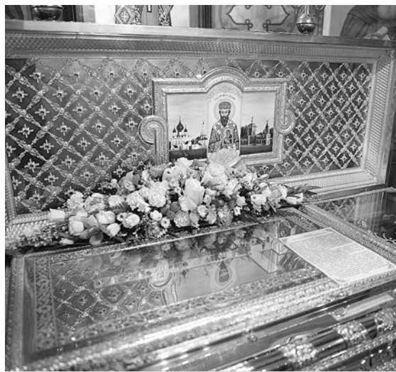
Мощи Арсения Элассонского в Успенском храме.