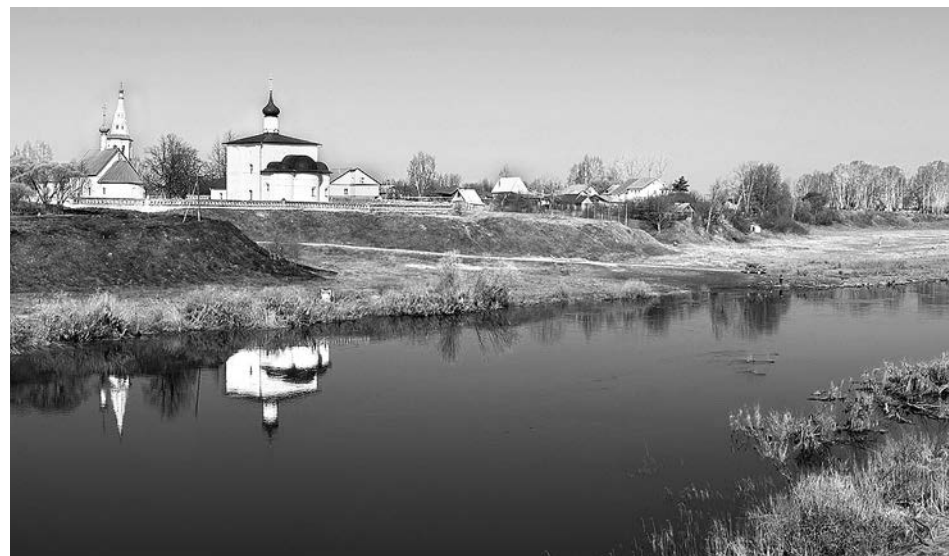
Река Нерль у села Кидекша.