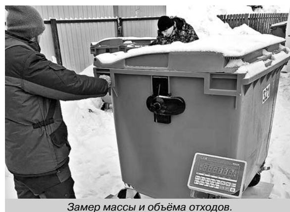
Замер массы и объёма отходов.

ГБУ ВО «Экорегион» приступил к работам, предшествующим корректировке нормативов накопления твёрдых коммунальных отходов во Владимирской области.