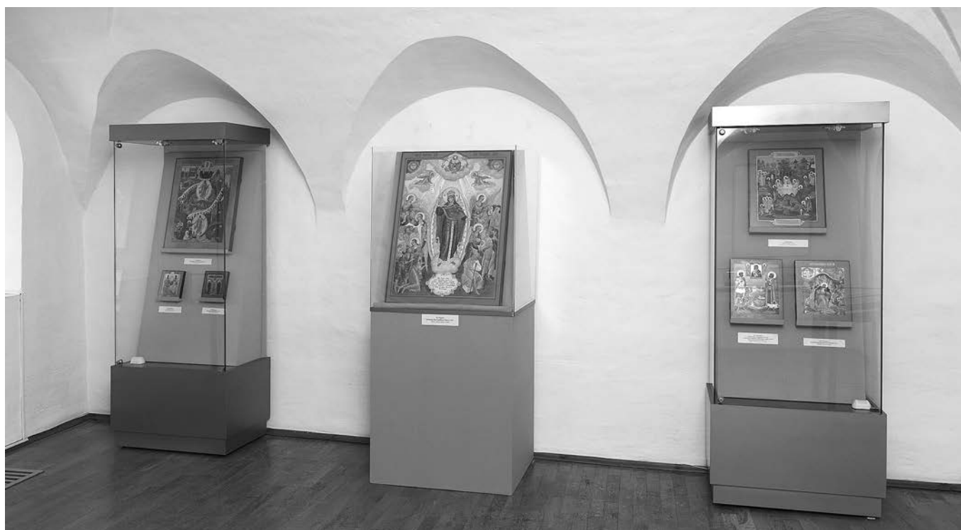
Фрагмент выставки «Возвращение к истокам».