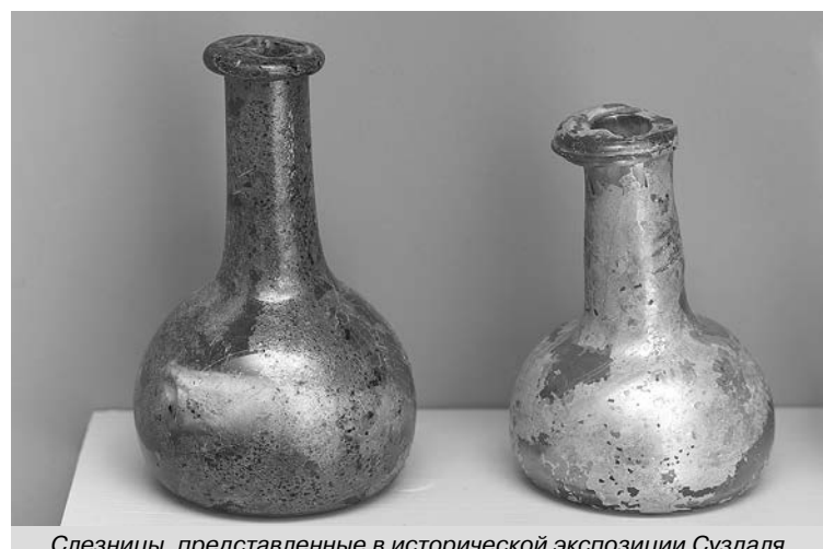
Слезницы, представленные в исторической экспозиции Суздаля.

удлиненное цилиндрическое горло с отогнутым краем. В музей поступил вместе с другими предметами в 1977 году после археологических раскопок у Цареконстантиновской и Скорбященской церквей. Другой флакон был обнаружен в Мжарском могильнике в 1980 г. Форма его колбообразная из полупрозрачного желто-зеленого стекла. Обе эти слезницы датируются XVII веком. Как использовались эти загадочные предметы в православной Руси семнадцатого столетия? Доподлинно неизвестно. Может быть, профессиональные плакальщицы приносили их на похороны? Или, возможно, эти сосуды были импортными товарами и применялись для хранения благовоний, например, елеса? И потом помещались в могилу усопшего?