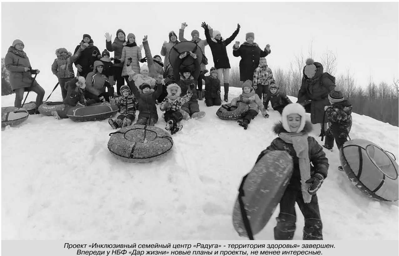
Проект «Инклюзивный семейный центр «Радуга» - территория здоровья» завершен. Впереди у НБФ «Дар жизни» новые планы и проекты, не менее интересные.