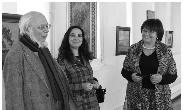
Выставка живописных произведений художника Ильи Каца в галерее Архиерейских палат.