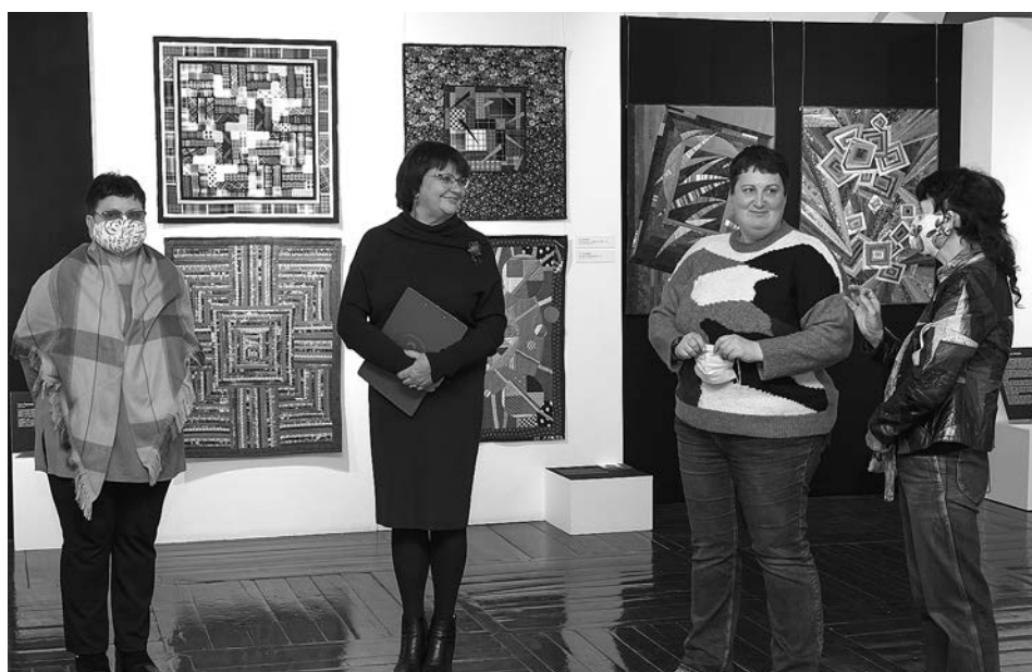
Выставка «Лоскутный авангард» в выставочном зале Суздальского кремля.