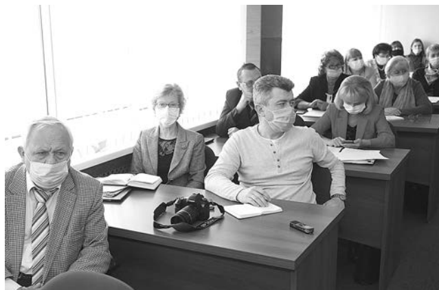
В работе ЗС приняли участие эксперты.

Вышли за рамки формального подхода: на заседании профильного комитета Законодательного собрания депутаты предметно обсудили результаты независимой оценки качества условий оказания услуг в социальной сфере.