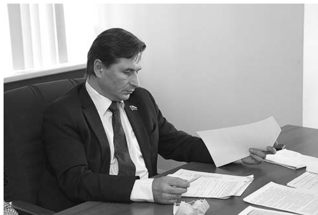
Сергей Бирюков, председатель комитета по социальной политике ЗС.