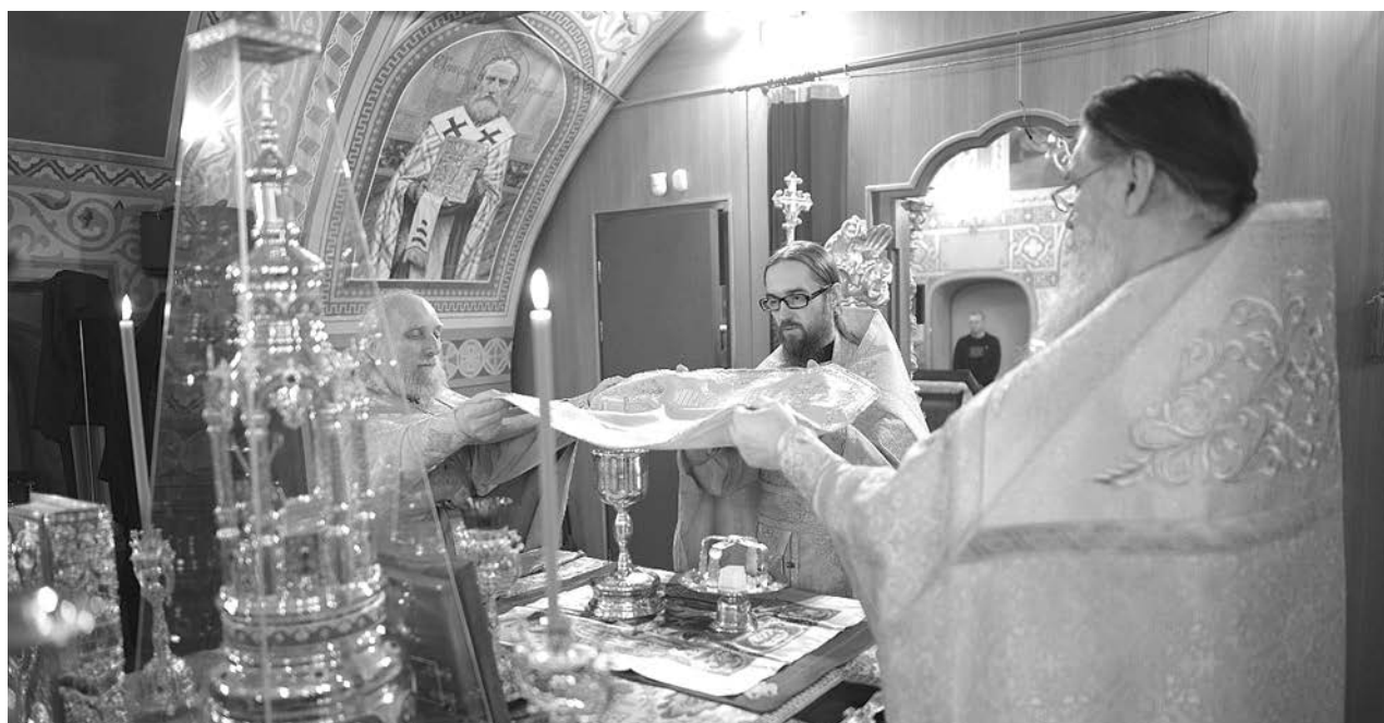
Божественная литургия в храме Успения Божией Матери на Княжем дворе.