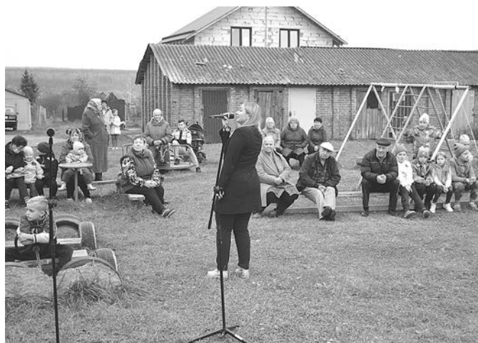
Артисты подарили жителям села улыбки и хорошее настроение.