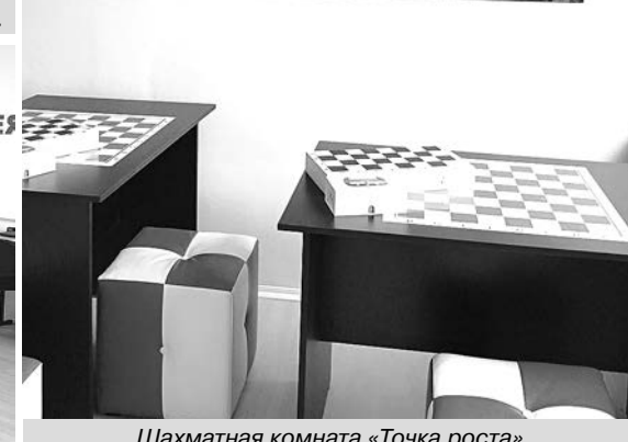
Шахматная комната «Точка роста» в Павловской СОШ.