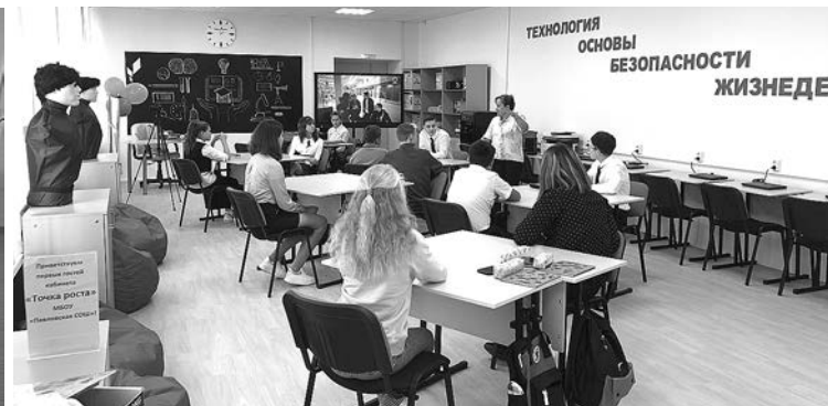
Начало работы «Точки роста» в Павловской СОШ.