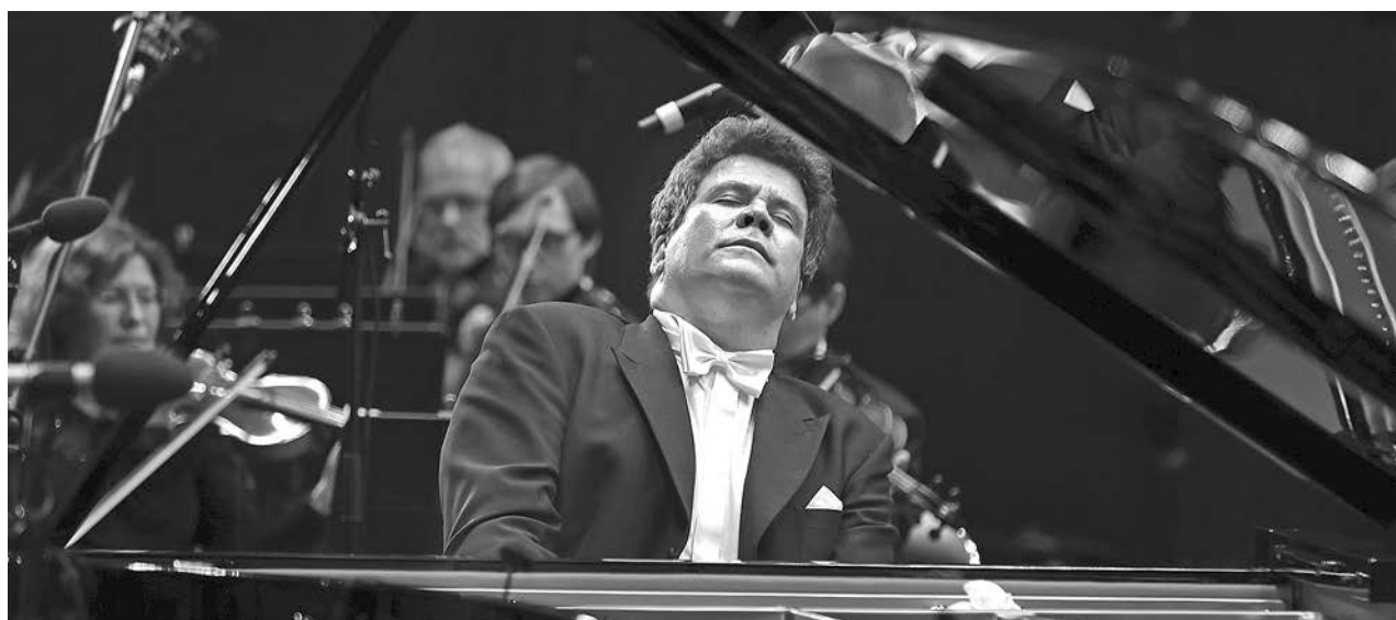
За роялем президент фонда «Новые имена», народный артист России Денис Мацуев.