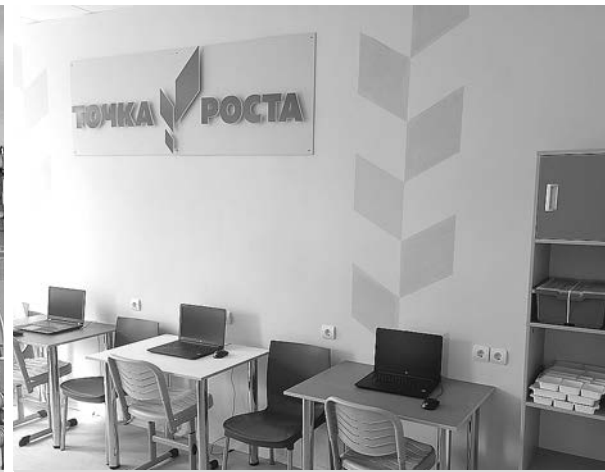
Кабинет цифровых компетенций в Стародворской СОШ.