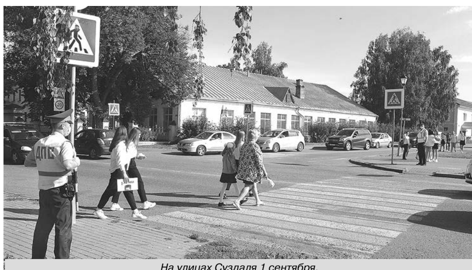
На улицах Суздаля 1 сентября.

Учредители: Владимирская епархия и Администрация Владимирской области и г. Владимира Вход свободный