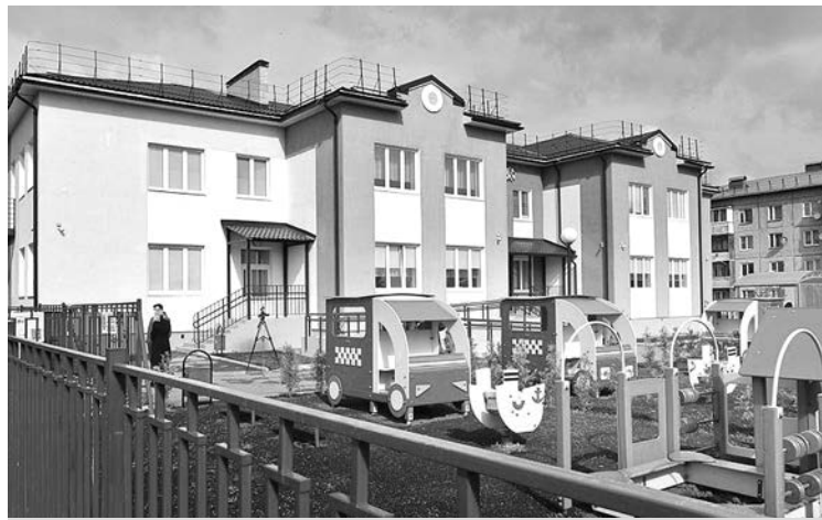
Новый детский сад в селе Сновицы.