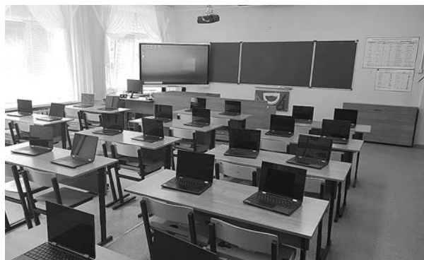
Новое оборудование ЦОС Сновицкой СОШ.