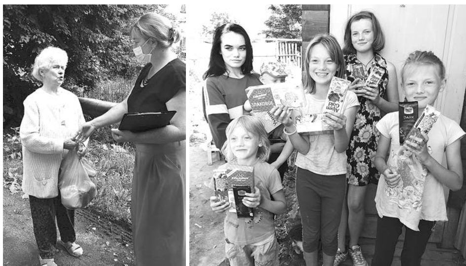
Помощь в период пандемии старикам и детям была очень важна.

Для того, чтобы сделать заказ, гражданам необходимо обратиться по телефону 8 (49231) 2-52-12. По данному телефону можно обращаться с 8.00 до 16.00 (с 12.00 до 13.00 обеденный перерыв).