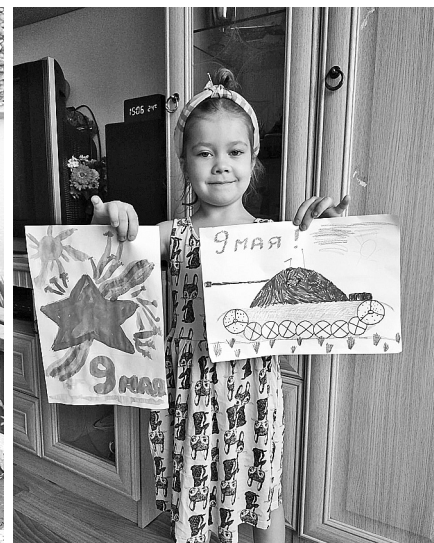
Участница акции «Письма Победы».