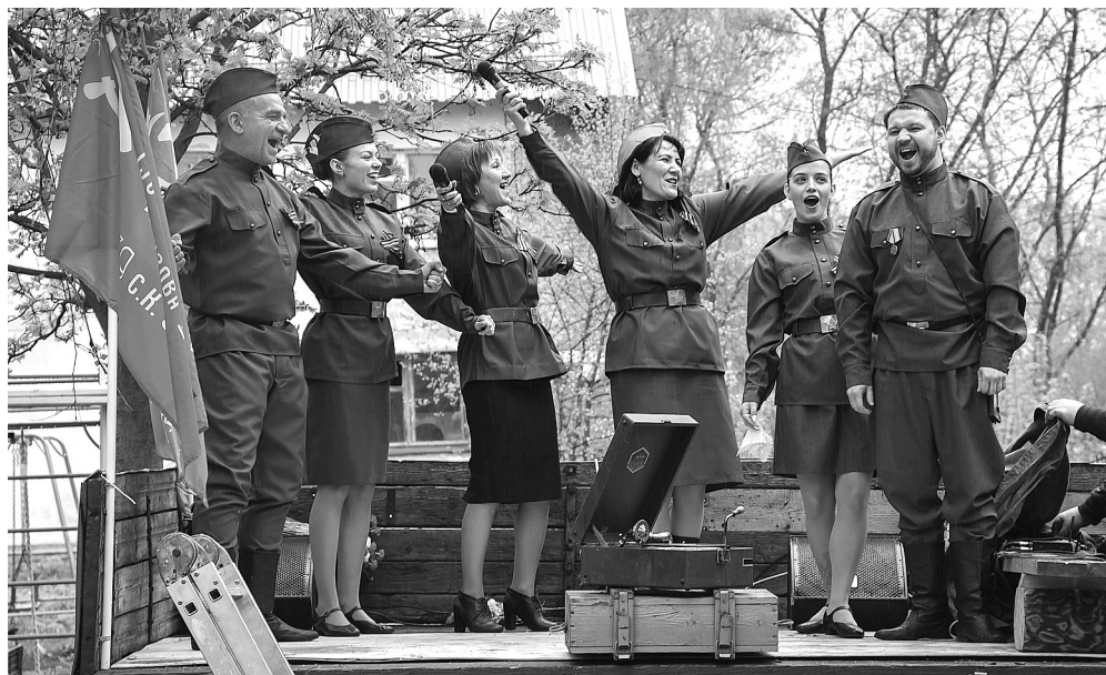
Выступает агитбригада артистов ЦКД г. Суздаля.