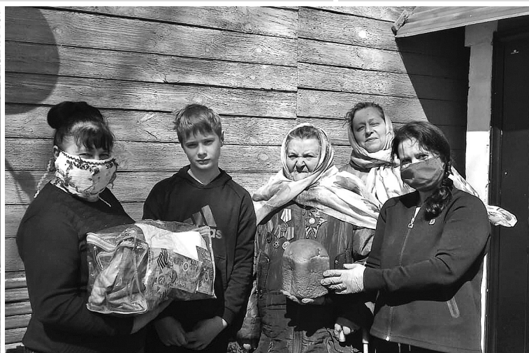
Подарки и сувениры, изготовленные руками детей, волонтеры вручают ветеранам войны, труженикам тыла, детям войны.