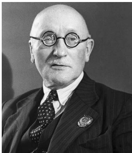
Игорь Эммануилович Грабарь.