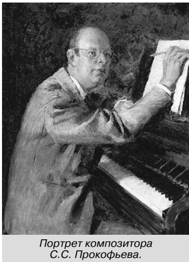
Портрет композитора С.С. Прокофьева.