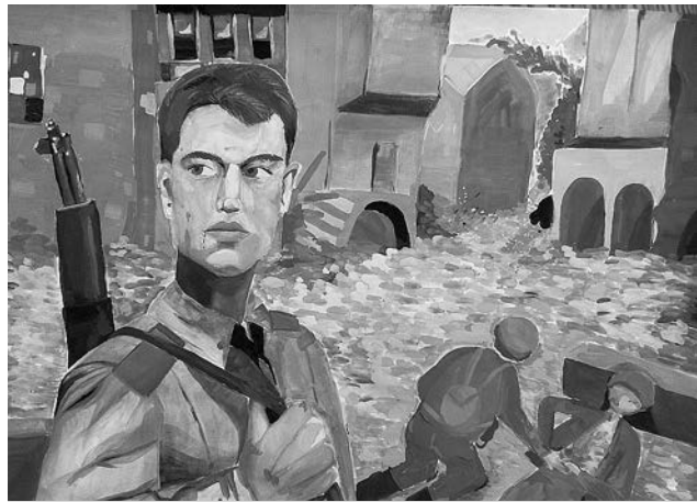
Работы воспитанников «Источка», победившие в Международном конкурсе «Престиж», в номинации «День Победы».

Если вы пока не готовы расстаться со старой техникой, не беда – помогите информационно. Расскажите об акции родственникам, друзьям, знакомым.