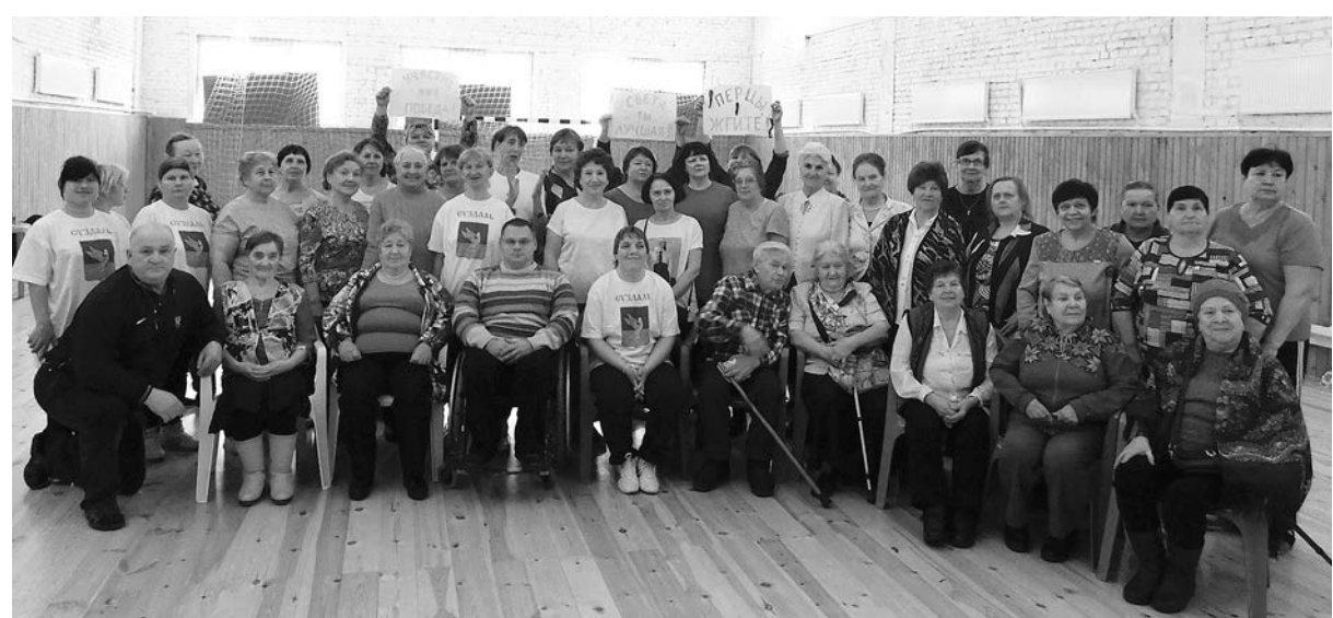
Участники культурно-спортивного праздника.