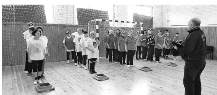
В «Веселых стартах» победила дружба.