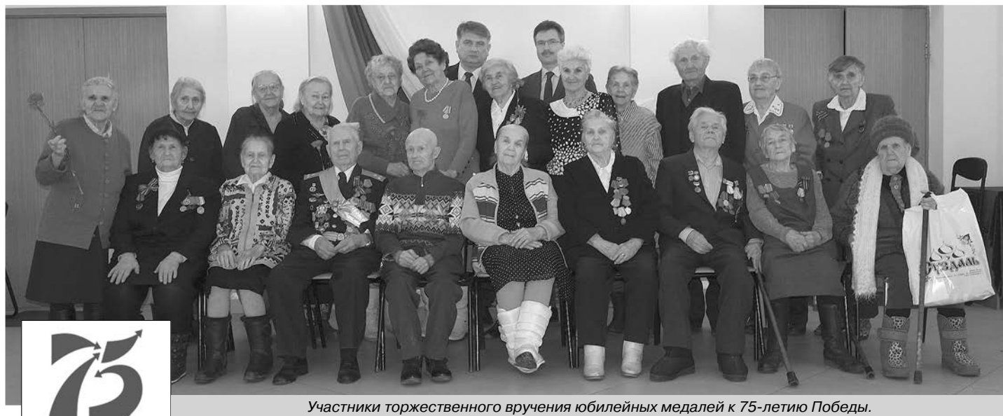
Участники торжественного вручения юбилейных медалей к 75-летию Победы.