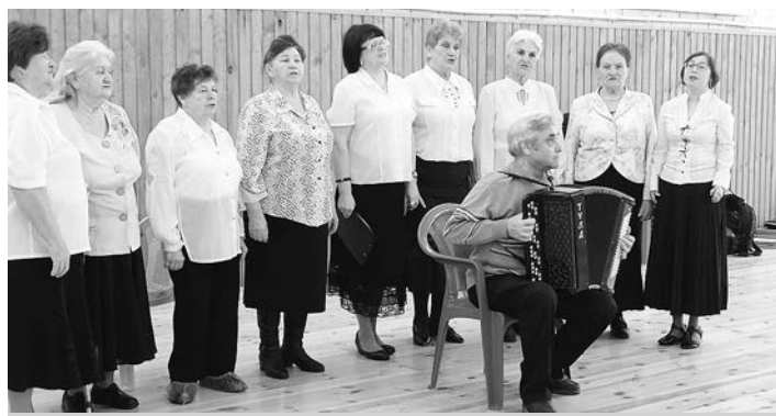
Поет хор «Радуйся».

В просторном спортзале собрались пять команд, но начали не с эстафет, а с концерта по случаю Международного женского дня. Чем не повод собраться вместе?