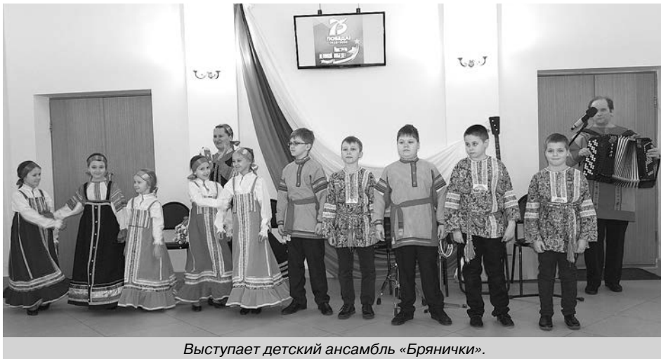
Выступает детский ансамбль «Брянички».