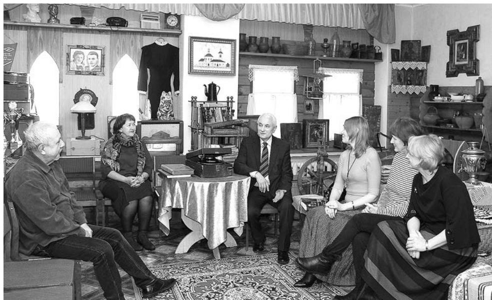
Выездное заседание президиума Суздальского районного отделения ВООПИиК в школьном музее села Павловское.