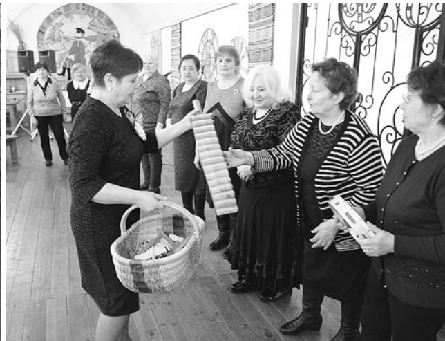
Все с удовольствием принимали участие в конкурсах.