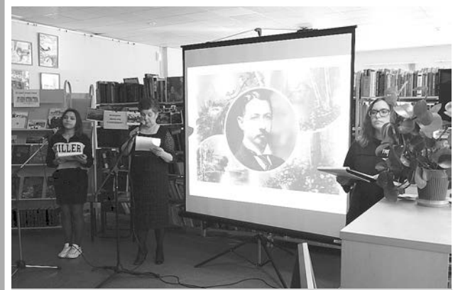
На литературном вечере, посвященном Ивану Бунину.