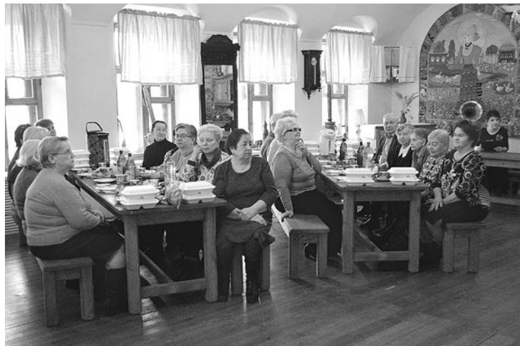
Настроение у участников встречи было отличным!