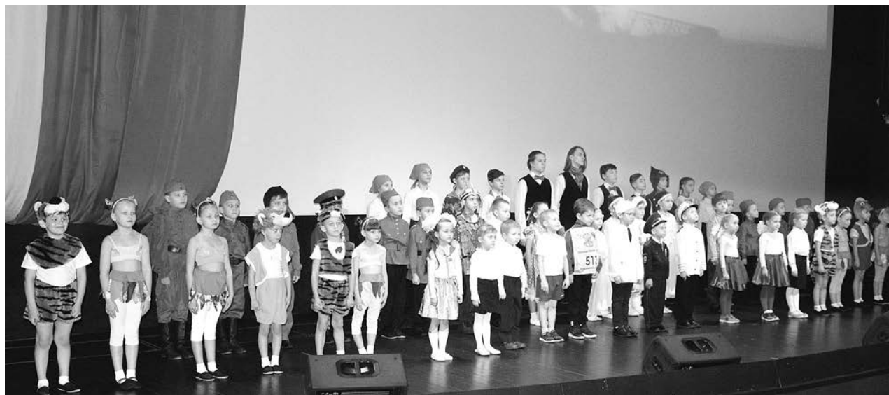
Ежегодный областной конкурс «Герой нашего времени» объединяет молодые таланты региона.