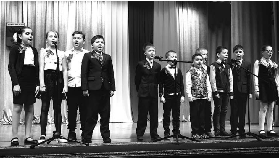
На фестивале военно-патриотической песни.

В канун Дня памяти воинов-интернационалистов в межпоселенческом методическом культурно-досуговом центре села Новое прошел открытый фестиваль военно-патриотической песни, который посвящался знаковому для всей страны юбилею — 75-летию Победы в Великой Отечественной войне. Организатором мероприятия выступило управление образования администрации Суздальского района.