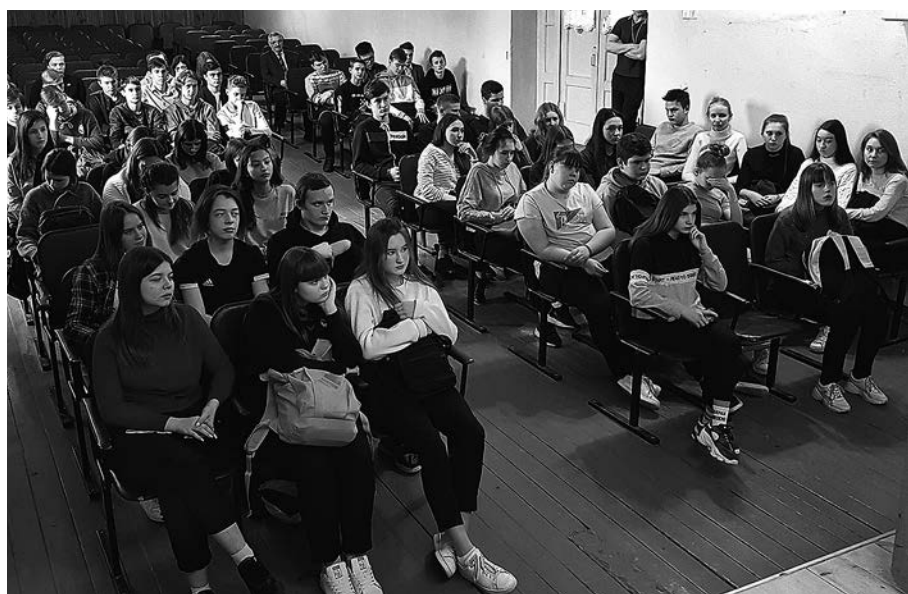
Школьники слушали гостей с большим вниманием.

В Суздале «АСКО-СТРАХОВАНИЕ» ведет свою деятельность на базе подразделения страховой компании «СЕРВИСРЕЗЕРВ» . Адрес офиса остался прежним: ул. Васильевская, д. 27 , сотрудники — те же, вся история страхователя сохраняется, по сути, для клиента ничего не изменилось, только название компании на страховом полисе.