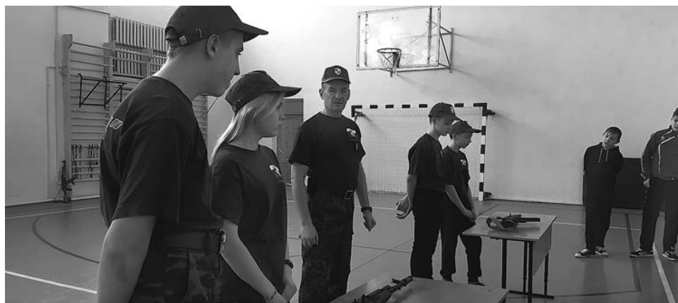
Ребята с увлечением и азартом участвовали в спортивных соревнованиях.