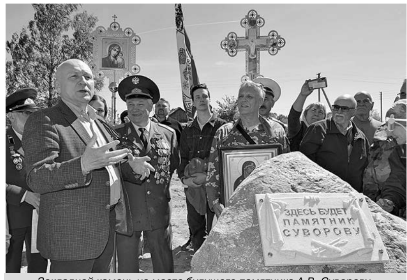
Закладной камень на месте будущего памятника А.В. Суворову.