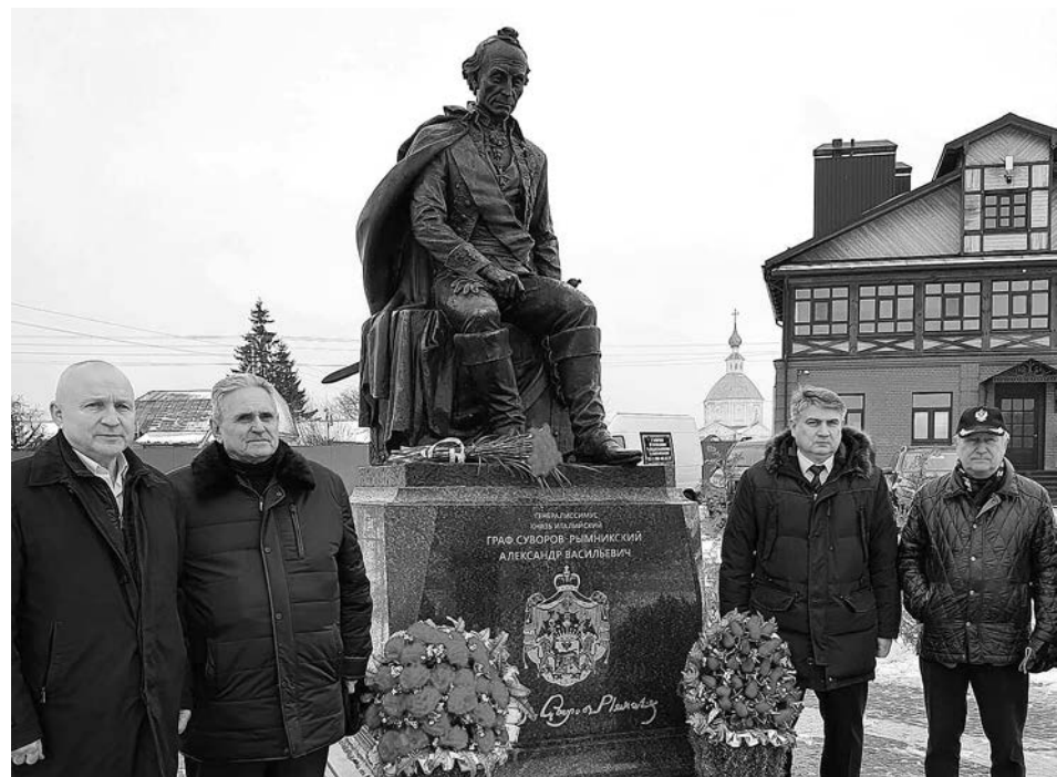
В день рождения полководца были возложены цветы к подножию памятника Генералиссимусу А.В. Суворову.