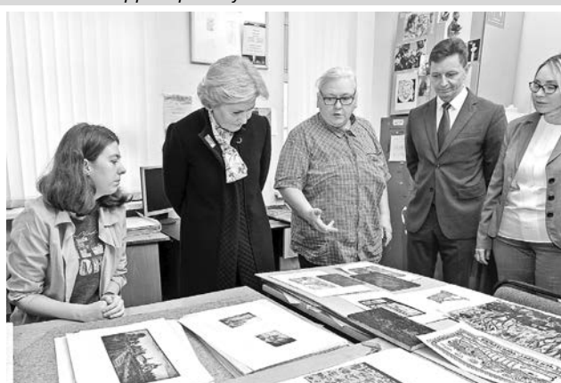
В Суздале Ольга Голодец посетила индустриально-гуманитарный колледж, Суздальский филиал Санкт-Петербургского государственного института культуры.