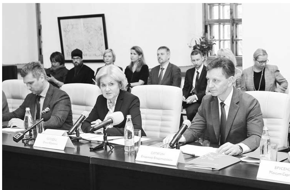
О. Голодец и В. Сипягин на совещании в Крестовой палате кремля.