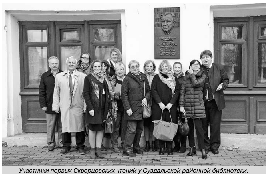
Участники первых Сковорцовских чтений у Суздальской районной библиотеки.