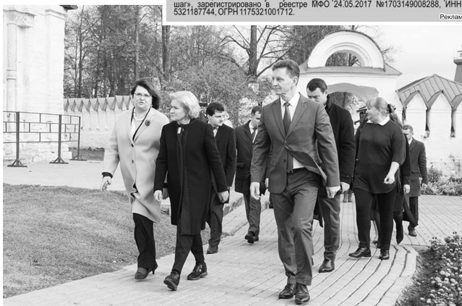
Гости на территории музея.