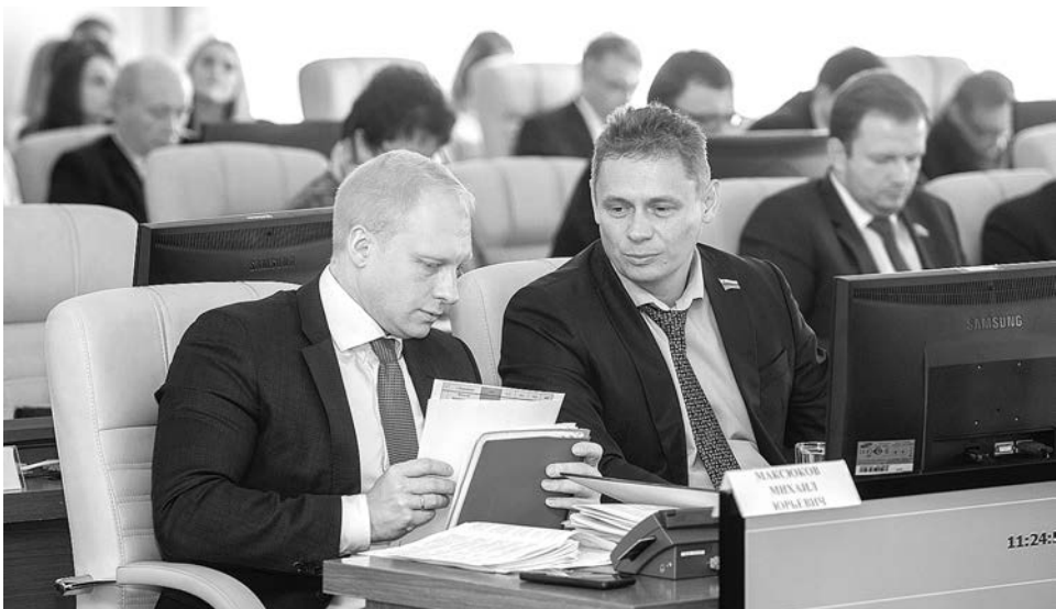
На октябрьском заседании Законодательного Собрания Владимирской области депутаты обсудили важные вопросы.