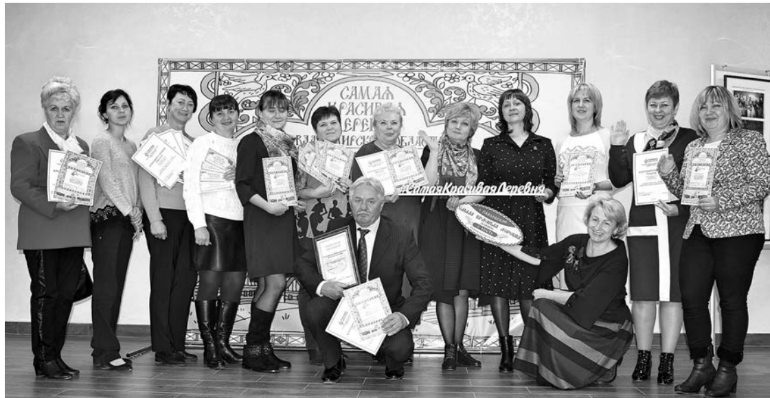
Победители и призеры конкурса «Самая красивая деревня Владимирской области» из Суздальского района.