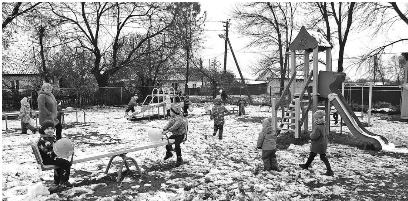
Новая игровая площадка в детском саду с. Мордыш.

Дошкольное учреждение в Мордыше на особом счету у местных жителей, ведь иметь детсад в селе, где живешь, очень важно для молодых родителей. Коллектив здесь не большой, но сплоченный и дружный. Взрослые прикладывают все усилия для того, чтобы детки, приходя в детсад, чувствовали себя как дома. Здесь чисто, светло, тепло, по-домашнему уютно. Каждый день происходит что-то новое, интересное, познавательное.