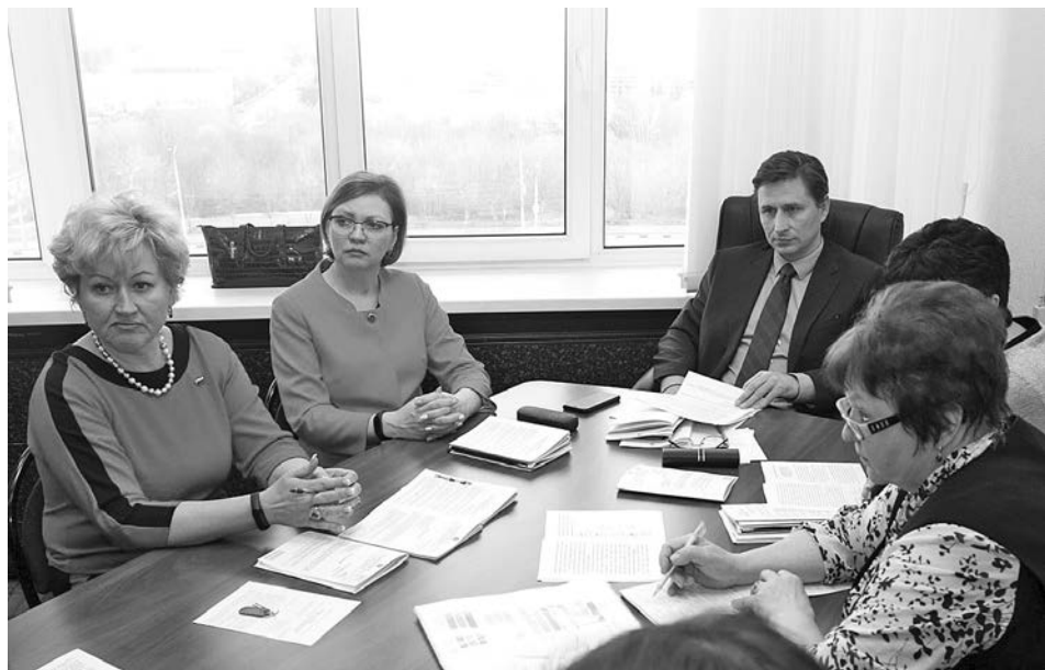
На заседании комитета по социальной политике и здравоохранению.

На заседании комитета по социальной политике и здравоохранению депутаты рассмотрели предложения по расширению мер соцподдержки медикам. Речь идет о корректировке закона о так называемой «медицинской ипотеке».