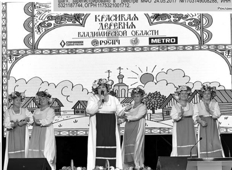
Музыкальный подарок победителям.