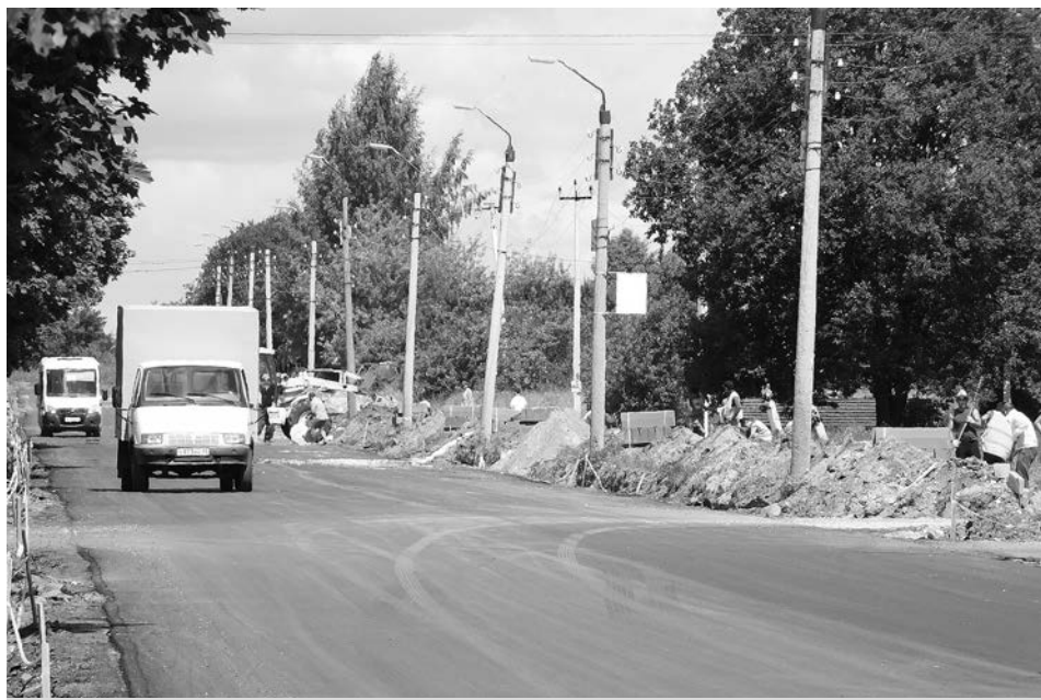
На улицах городов и сел будет больше хороших дорог.