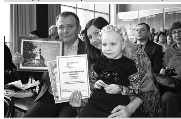
Село Кистыш - победитель в интернет-голосовании в своей категории.