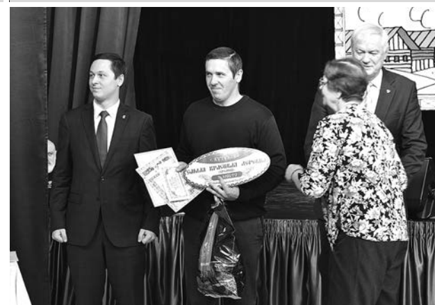
Село Кутуково заняло третье место в своей категории.