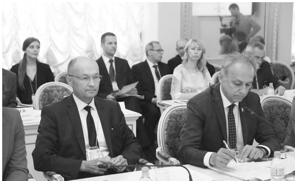
Председатель Законодательного Собрания области Владимир Киселёв на шестом форуме регионов России и Беларуси.