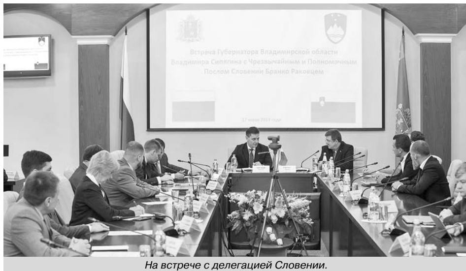
На встрече с делегацией Словении.