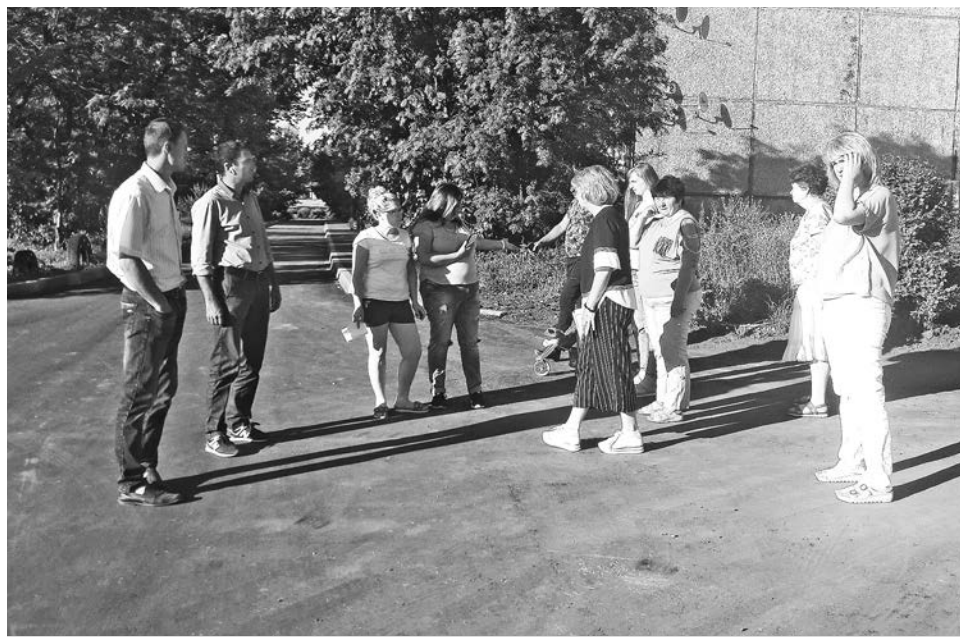
Приемка работ по асфальтированию дворовых проездов общественной комиссией.

Площадкой фестиваля по традиции станет территория Владимиро-Суздальского музея-заповедника – Суздальский кремль.