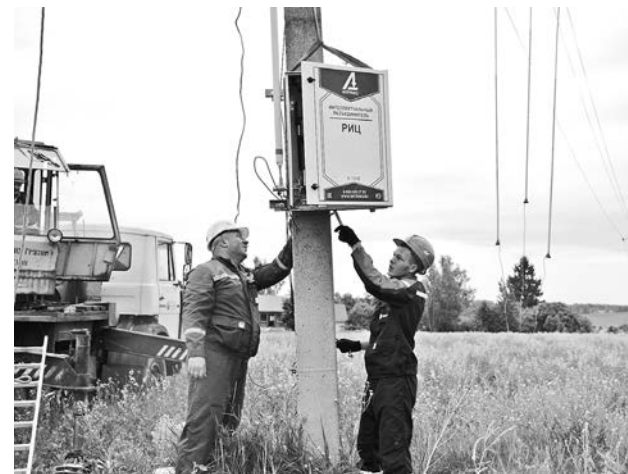
Идет монтаж интеллектуального цифрового оборудования

Напомним, Владимирская область - один из пилотных регионов, на территории которого реализуется инновационный проект по модернизации электросетевого комплекса с применением цифровых технологий, что позволит повысить эффективность функционирования электросетевого