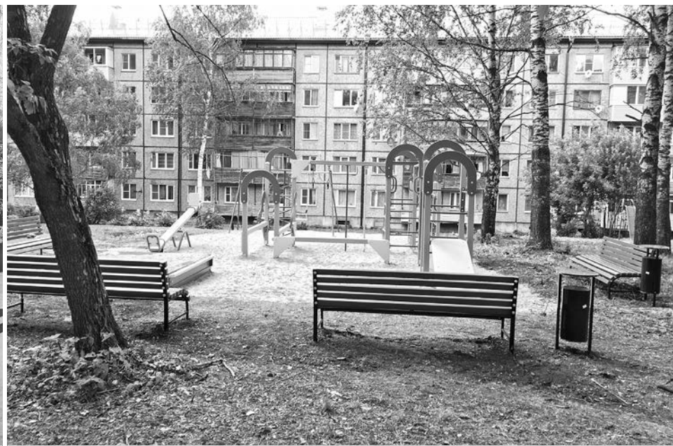
Новая детская площадка в п. Садовый.