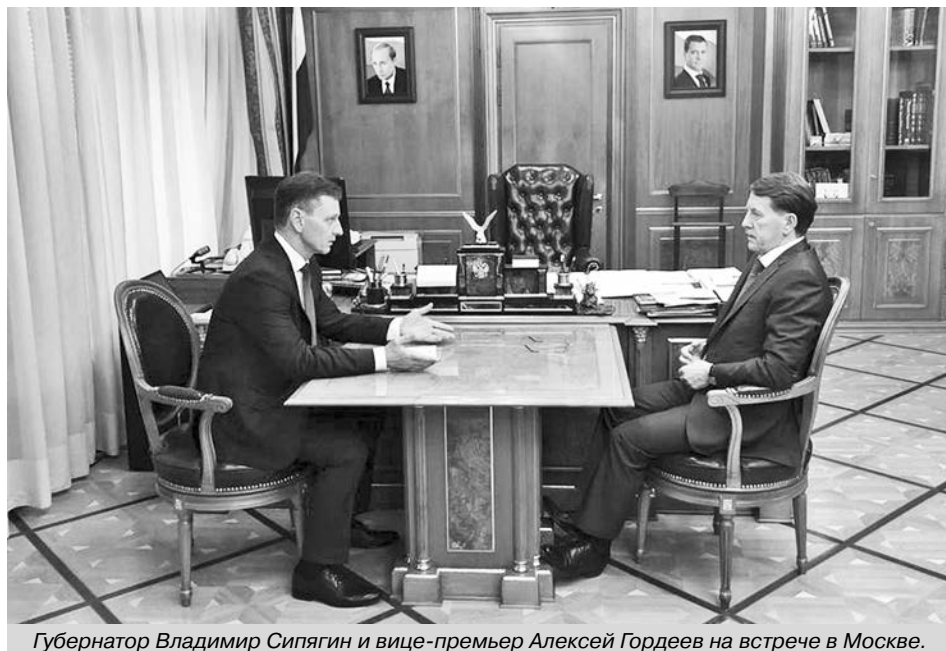
Губернатор Владимир Сипягин и вице-премьер Алексей Гордеев на встрече в Москве.

Спасение завода в Селивановском районе стало возможным благодаря усилиям Губернатора Владимира Сипягина. По его просьбе Правительство России одобрило сделку между группой компаний «АСТОН» и Archer Daniels Midland Company по покупке предприятия, а значит его сотрудники не потеряют работу.