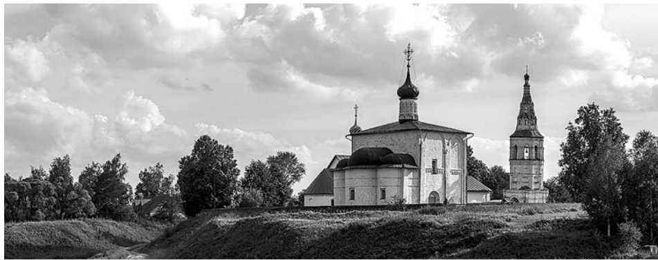
Храм Бориса и Глеба в Кидекше.

Василий Иоаннович Спасский (ок. 1843-после 1877) Окончил Владимирскую духовную семинарию в 1862 г. У Малицкого указано, что священником села