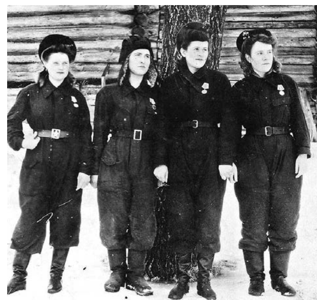
Девушки-трактористки, награжденные медалями «За доблестный труд в Великой Отечественной войне».

4. Закончить уборку яровых в 6 дней, озимых – в 7 дней.