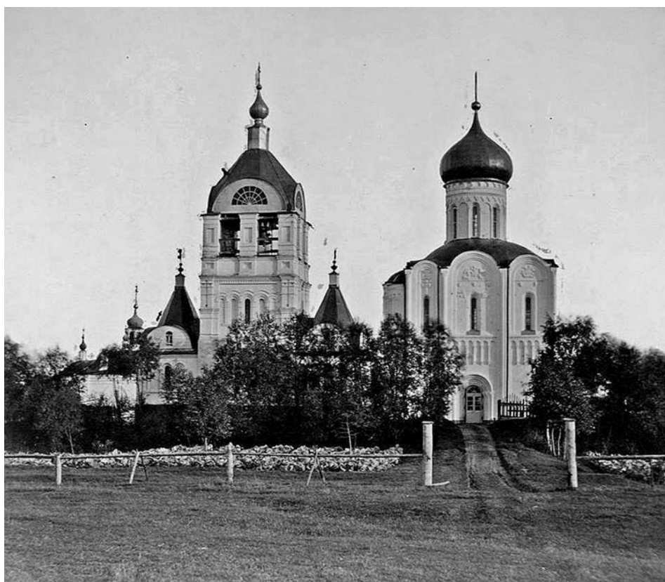
ДРЕВНЯЯ ПОКРОВСКАЯ ЦЕРКОВЬ БЛИЗЬ БОГОЛЮБОВА.

Храм был посвящён празднику Покрова Богородицы, которая считалась Покровительницей всей Владимирской земли. В поход князь брал с собой икону «Богоматерь Владимирская», уповав на её помощь. Покров как первый общерусский праздник зародился на Владимирской земле в атмосфере прославления Богородицы и веры в богоизбранность Владимирской земли, находившейся в это время в периоде невиданного подъёма и расцвета. Храм Покрова на Нерли зримо выражает неукротимое стремление ввысь. Его часто сравнивают со свечой, языки пламени которой поднимаются в небеса и в них растворяются. Существует легенда о вспыхивающем в хра-