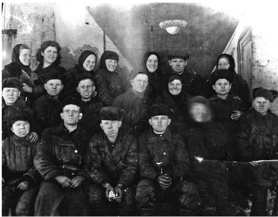
Механизаторы и их помощники в мастерской совхоза.