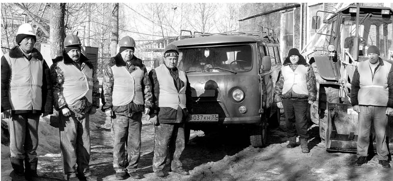
Аварийно-восстановительная бригада МБУ «ДЕЗ».