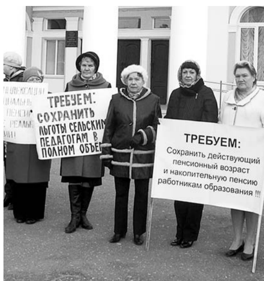
Участники пикета акции профсоюзов «За достойный труд!».