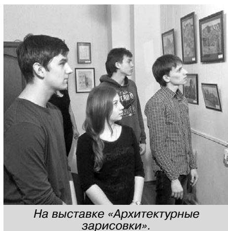
На выставке «Архитектурные зарисовки».