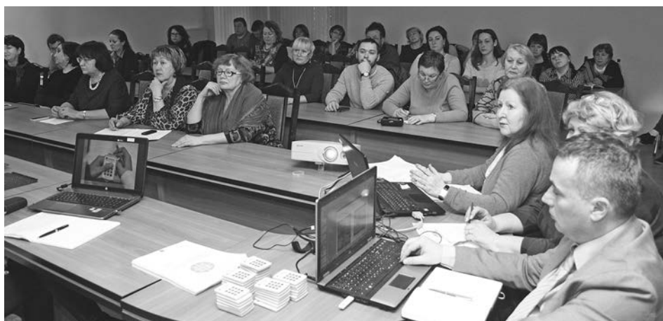
Участники рабочей встречи с группой экспертов в Суздале.