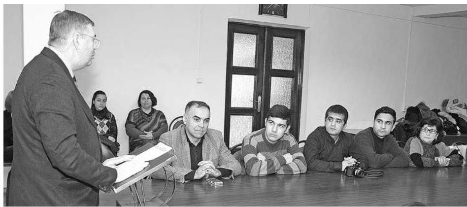
Игорь Кехтер на встрече со школьниками и студентами из Азербайджана и Турции.