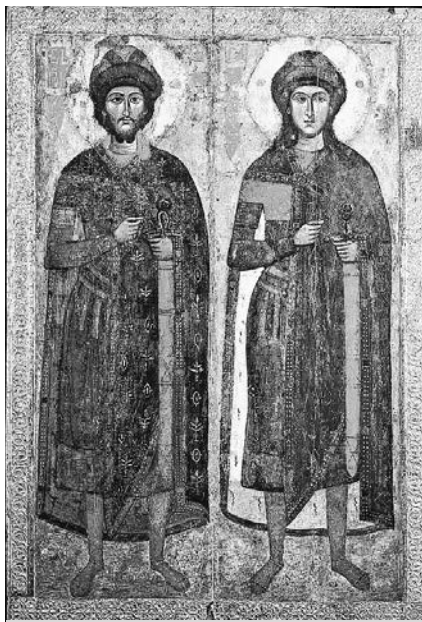
Святые Борис и Глеб.