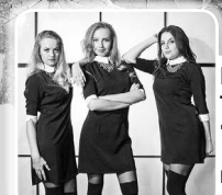
Вокальное трио «Небеса» 11 ноября в 19.00