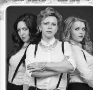
Шоу- группа «Шоколад» 4 ноября в 19.00