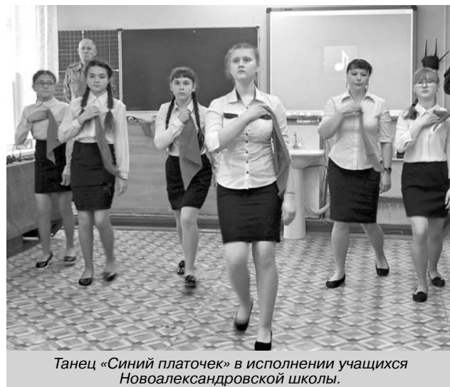
Танец «Синий платочек» в исполнении учащихся Новоалександровской школы.

«Гром» были обнаружены останки 836 бойцов и командиров Красной Армии, из них идентифицированы только 36, найдены родственники у 25.