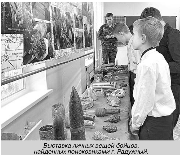
Выставка личных вещей бойцов, найденных поисковиками г. Радужный.

Для многих российских семей война так еще и не закончилась, некоторые до сих пор получают весточки от своих родных и близких, не вернувшихся с войны. В основном это происходит благодаря поисковикам. Много слов благодарности было сказано в адрес руководителей поисковых отрядов, присутствующих на мероприятии, за их вклад в увековечение памяти погибших защитников Отечества. Вдумайтесь только, в период с 2001 по 2018 год участниками Ассоциации поисковых отрядов