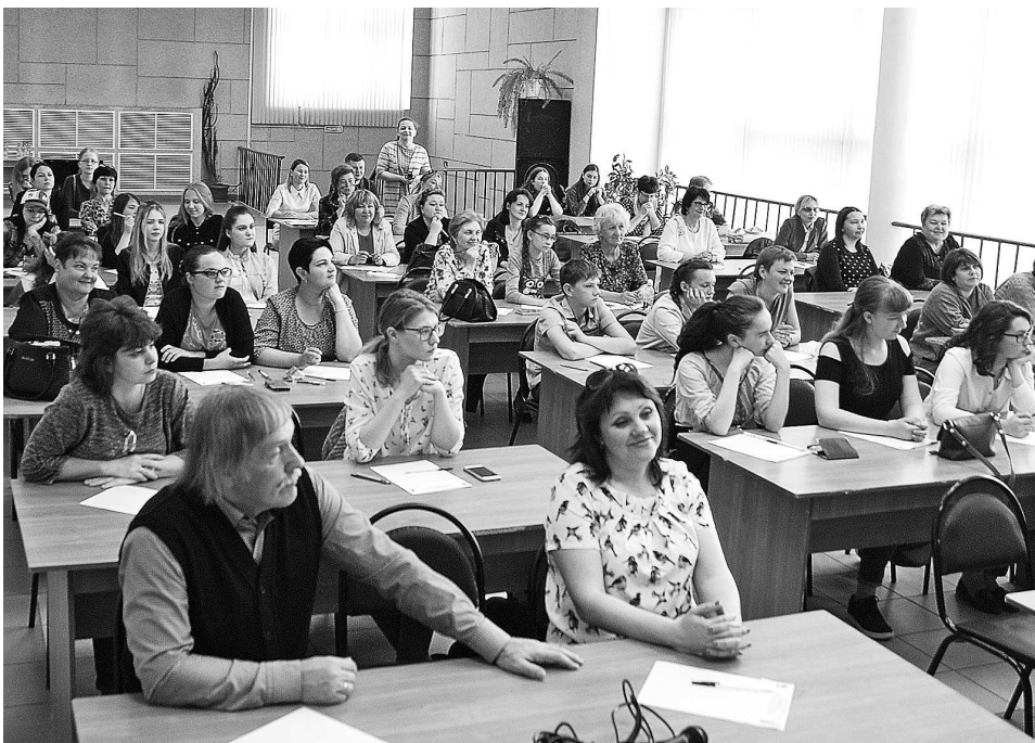
Участники «Открытого диктанта».