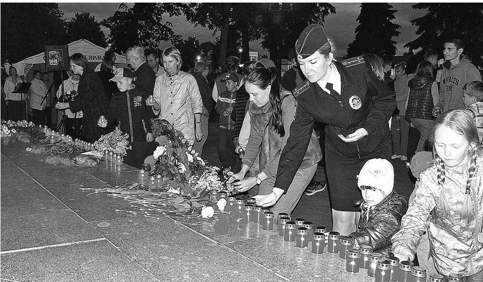
Акция «Свеча скорби» в Суздале.