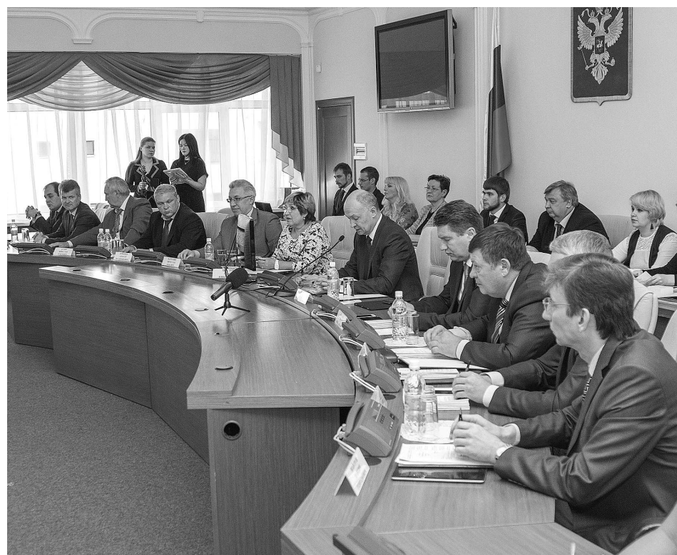
На заседании Законодательного Собрания области.

По итогам слушаний были выработаны рекомендации и поставлены задачи на перспективу. Среди них - продолжить поиск резервов увеличения доходов бюджета, активно работать по снижению налоговой задолженности, еще больше повышать эффективность расходования бюджетных средств (на всех уровнях), постараться обеспечить участие области в федеральных целевых программах по разным направлениям. Важная социальная задача - завершить переселение граждан из аварийного жилищного фонда, признанного непригодным для проживания по состоянию на 1 января 2012 года. Есть планы при формировании проекта областного бюджета на 2018-2020 годы заложить возможность индексации оплаты труда работников государственных учреждений, не вошедших в "дорожные карты".