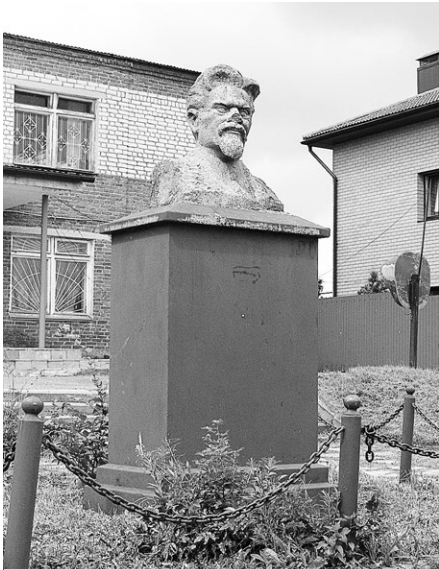
Памятник М.И. Калинину, чье имя носил колхоз, требует реставрации.