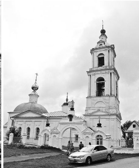
Спасо-Преображенский храм в Порецком.