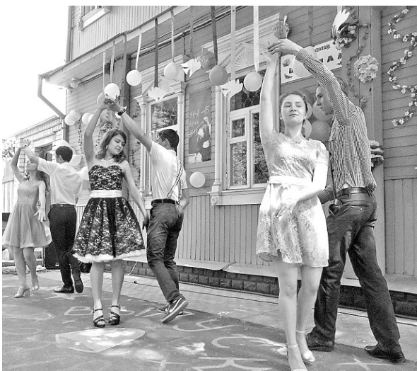
Кружатся в вальсе гимназисты.