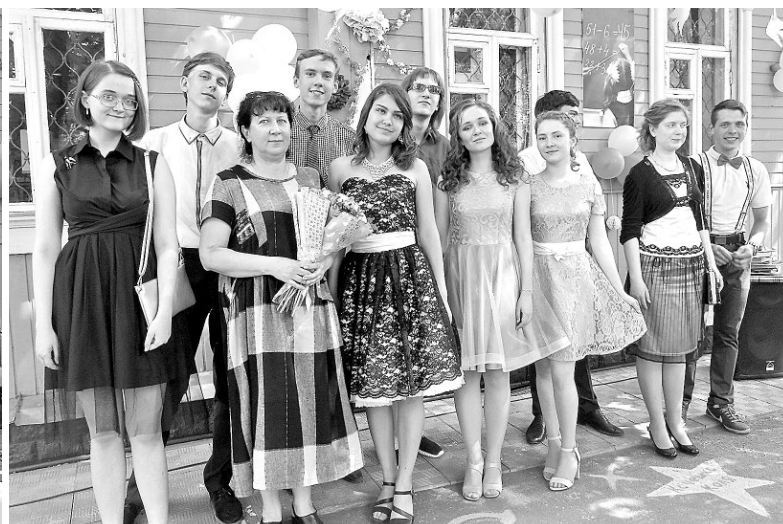
Фотография на память в стенах родной гимназии.