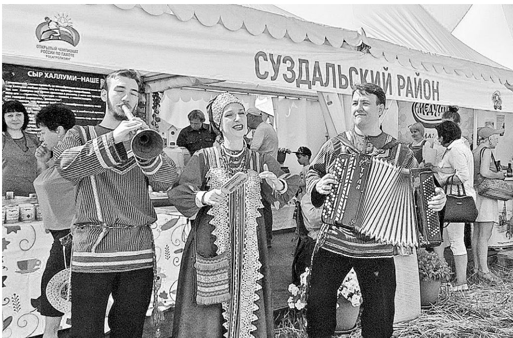
Для гостей и участников чемпионата по пахоте выступали лучшие коллективы области.