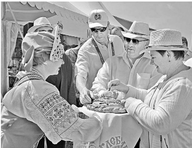
Губернатора С. Орлова и почетных гостей встречали хлебом-солью.