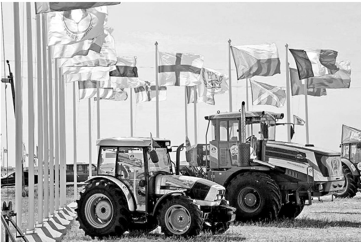
Европейский чемпионат по пахоте Россия принимала впервые.