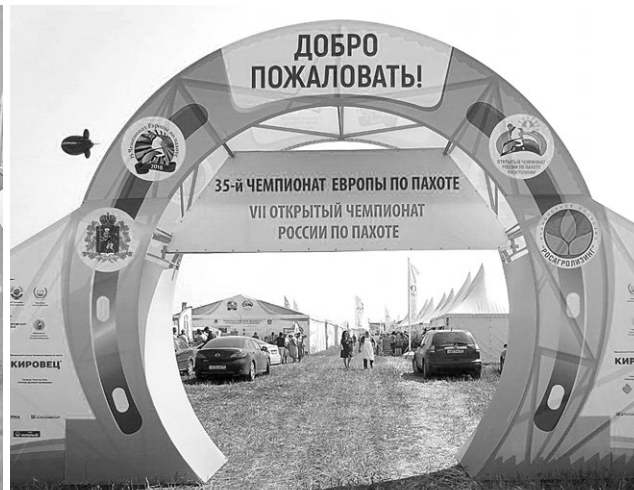
Владимирская область превратилась в дни чемпионатов в столицу мирового пахотного движения.