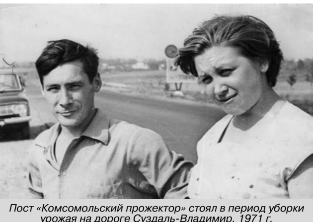
Пост «Комсомольский прожектор» стоял в период уборки урожая на дороге Суздаль-Владимир, 1971 г.