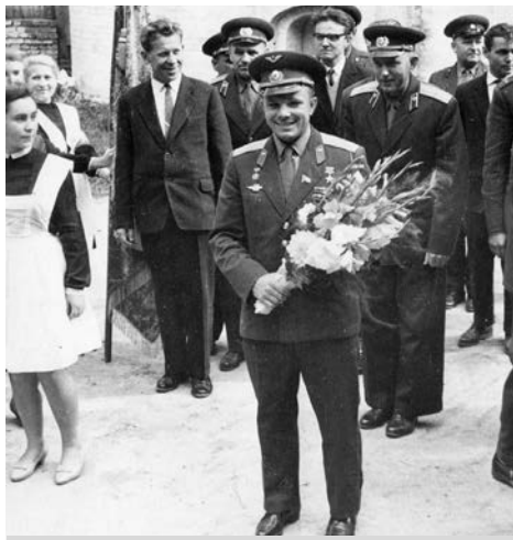
Приезд Юрия Гагарина, первого космонавта Земли в Суздаль в спецучилище для несовершеннолетних. В этом училище была комсомольская организация, куда принимали только лучших из лучших, 1963 г.