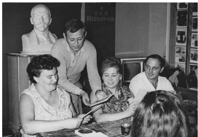
Встреча с молодежной делегацией города Лоуны (Чехословакия), 1972 г.