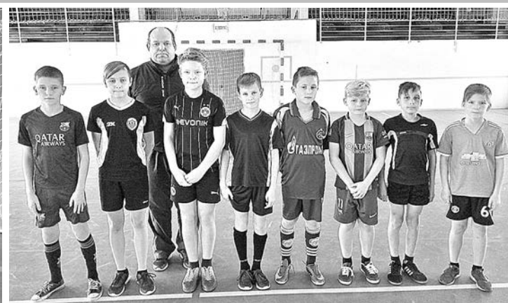
Команда Боголюбовской средней школы.

16 октября на базе физкультурно-оздоровительного комплекса с. Павловское прошло первенство Суздальского района по мини-футболу среди юношей 2005-2006 г.р. «Мяч дружбы».