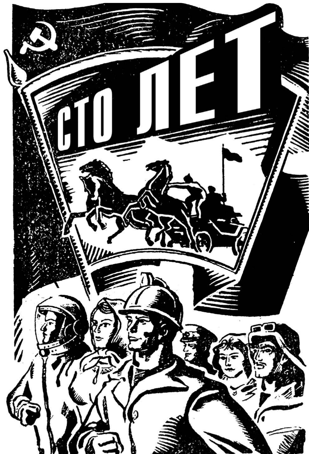
Плакат художника Михаила Белана.