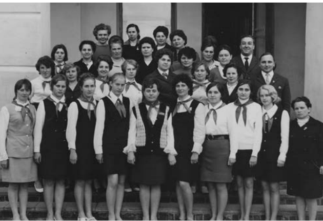
Участники слета пионерских вожатых.