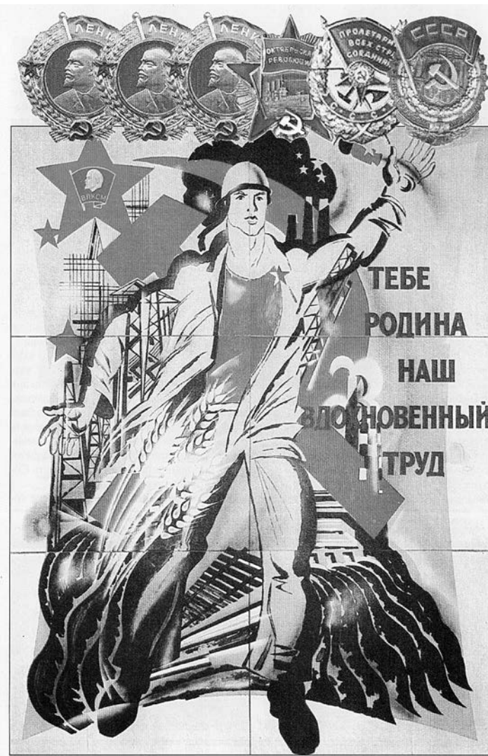
У комсомола - шесть орденов за боевые и трудовые подвиги.

После института армия – еще одна школа жизни. В особые пограничные войска я попадаю по комсомольской путевке (комсомол берет ответственность за рекомендуемые кадры). В армии анкеты мы не заполняем, но в пограничных своих проверки: по результатам я рекомендован и избран секретарем комсомольской организации роты. Здесь же, в армии, мне наряду с наиболее активными комсомольцами, предлагают вступить в партию. Демобилизовался я уже членом партии и поступил на службу в Суздальский РОВД. И вот уже партийная организация дает мне поручение: возглавить комсомольскую организацию РОВД (кстати, одну из самых многочисленных в районе). И опять как в песне: «Партия сказала: надо! Комсомол ответил: есть!». Таким образом, в 1981