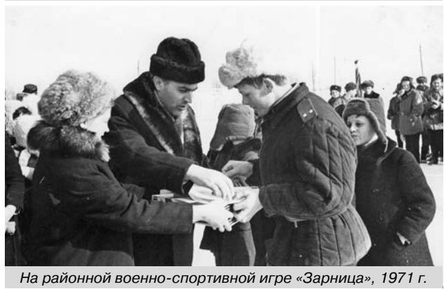
На районной военно-спортивной игре «Зарница», 1971 г.