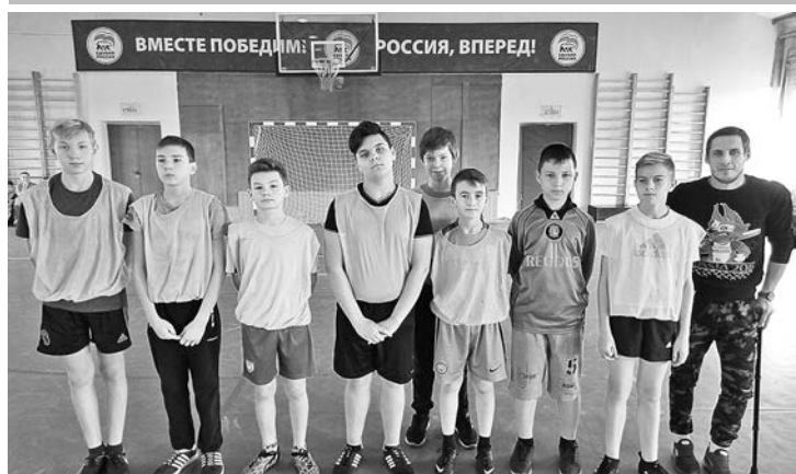
Команда средней школы №1 г. Суздаля.