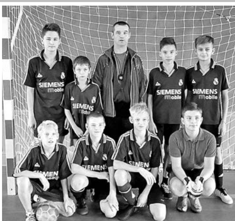
Команда средней школы №2 г. Суздаля.