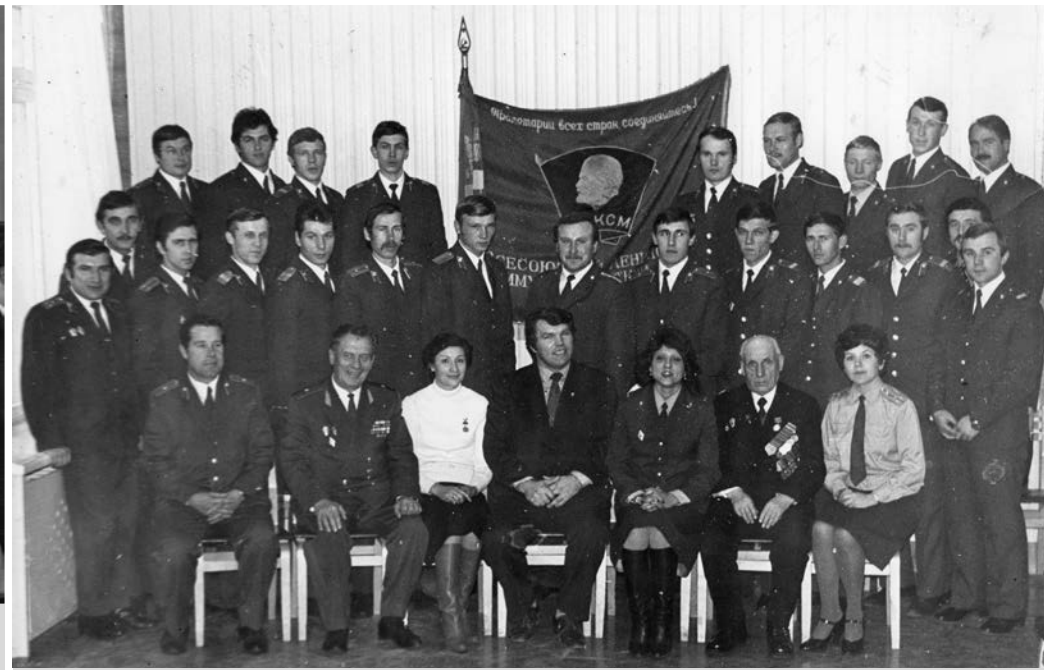
Делегаты комсомольских организаций РОВД на отчетно-выборной конференции, 1984 г.