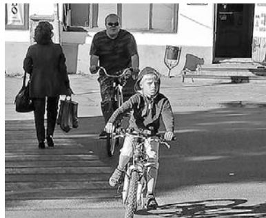
Фотообвинения, сделанные ребятами.