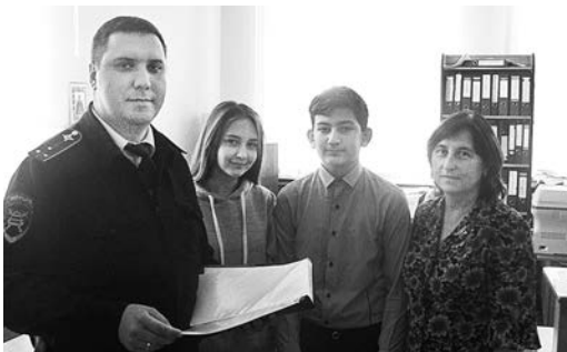
Участники проекта в местном ОГИБДД.