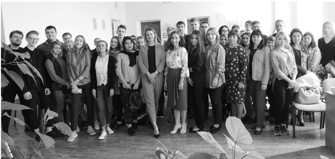
Участники встречи с представителями Молодежной Думы Владимирской области.