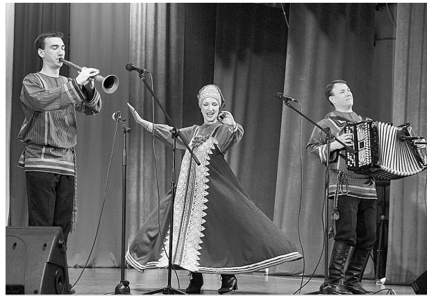
Семейный ансамбль «Родня».