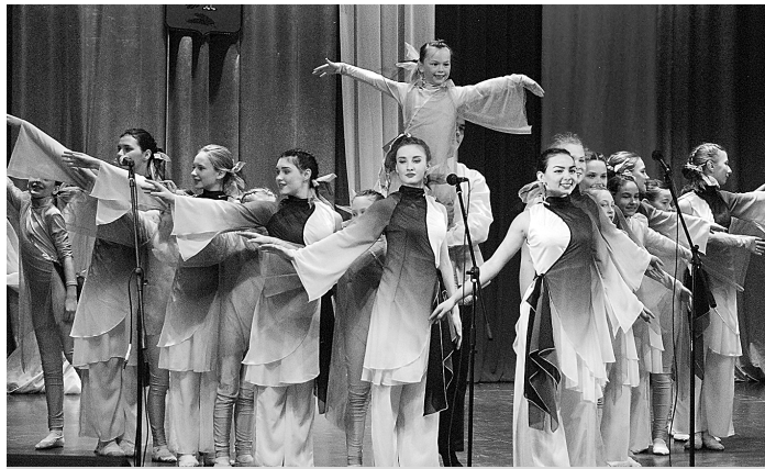
Хореографический ансамбль «Весна» ДК поселка Боголюбово.