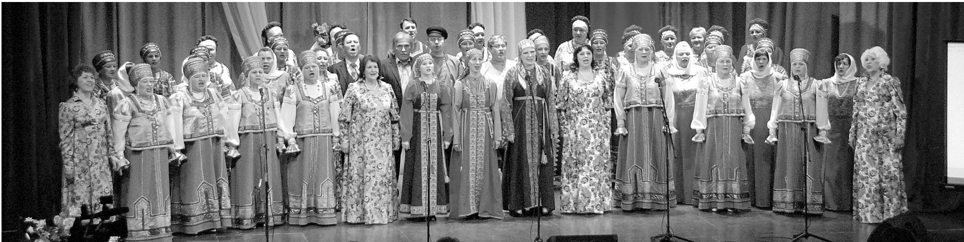
Сводный хор творческих коллективов муниципальных учреждений культуры Суздальского района.