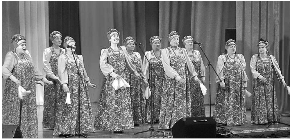
Народный коллектив «Любава» ДК поселка Боголюбово.