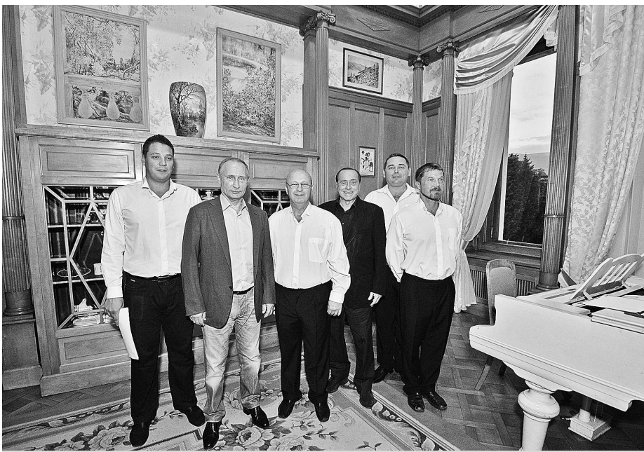
Мужская капелла «Благовест» после выступления перед Владимиром Путиным и Сильвио Берлускони.