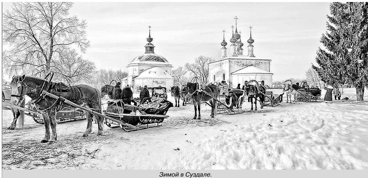
Зимой в Суздале.