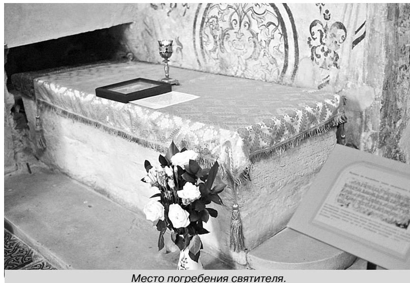
Место погребения святителя.

22 мая 1654 года Патриарх Никон по просьбе братии посвятил Илариона в сан иеромонаха, признав его «зело искусным в Священном Писании».