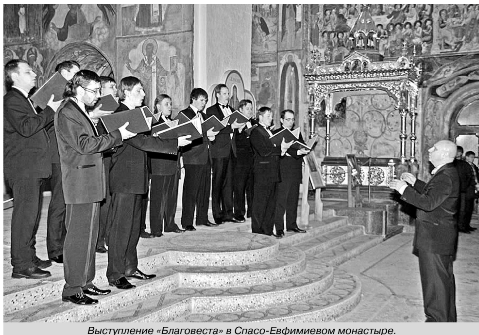
Выступление «Благовеста» в Спасо-Евфимиевом монастыре.