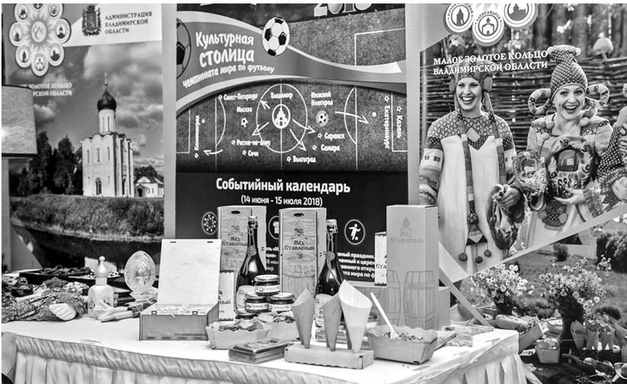
Выставка Владимирской области в рамках Российской гастрономической недели на Кипре.

Администрация города Суздаля напоминает, что 1 декабря текущего года истекает срок уплаты по налогам (земельный, транспортный и налог на имущество физических лиц), начисленным за 2016 год. Всем, кто не получил квитанции на налоги, необходимо обратиться в почтовое отделение связи или Межрайонную ИФНС России № 10 по Владимирской области по адресу: г. Суздаль, Красная площадь, д. 1, 3-й этаж , контактный телефон 2-12-61 . После 1 декабря 2016 года за неуплаченные налоги будут начисляться пени.