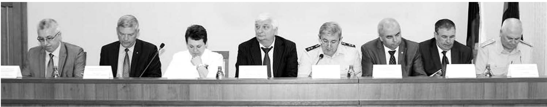
Участники коллегии прокуратуры 33-го региона.