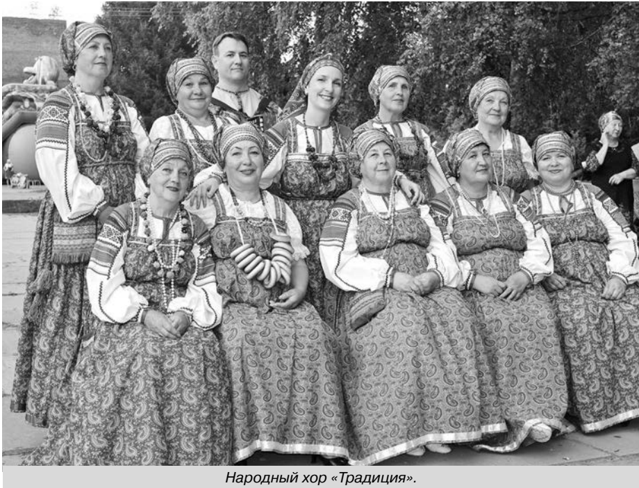
Народный хор «Традиция».