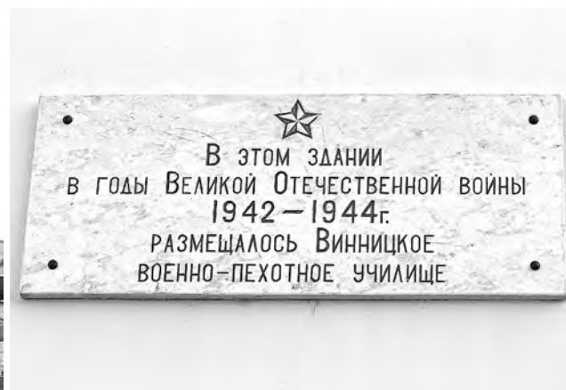
Курсанты Винницкого военно-пехотного училища на территории кремля и одно из зданий, где оно располагалось в Суздале.