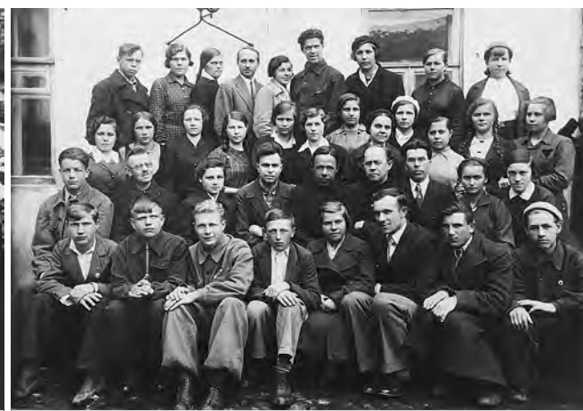
«Огненный выпуск» 1941 года.