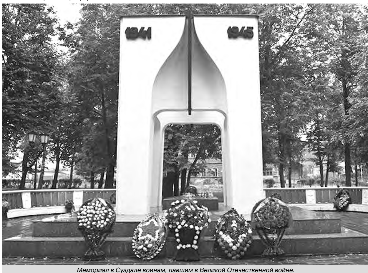
Мемориал в Суздале воинам, павшим в Великой Отечественной войне.

Из местного населения создаётся народное ополчение, сбор добровольцев-ополченцев состоялся на Красной площади Суздаля уже 7 июля. На 20 ноября 1941 г. в народное ополчение записалось 257 чел. (в том числе 42 коммуниста и 10 комсомольцев). Рота народного ополчения с 14 ноября 1941 г. была переведена на военное положение и отправлена на строительство военных объектов.