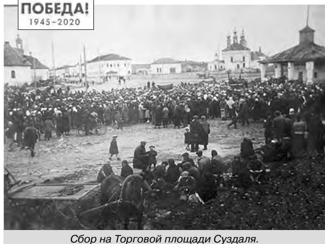
Сбор на Торговой площади Суздаля.