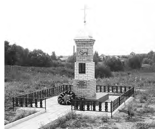
Памятник погибшим воинам в одном из сел района.