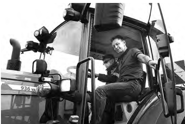
Губернатор В. Сипягин в СПК «Шихобалово».

Стационарные оздоровительные организации будут переведены в режим полного запрета на посещение посторонними. Неполняемость групп и отрядов будет составлять не более 50 процентов от проектной мощности лагеря.