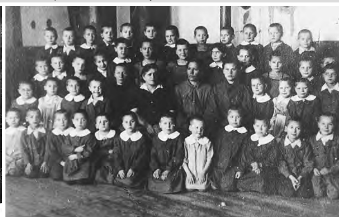
Дети из блокадного Ленинграда - воспитанники детских домов.

Несмотря на героический труд, надо отметить, что нехватка техники, кормов для скота, квалифицированных кадров и просто рабочих рук, отсутствие агротехники привели к ухудшению положения сельского хозяйства в целом. Урожайность и продуктивность скота в общем по району в годы войны были невысокие: в 1941 г. собранный урожай зерновых составил 4–6 ц с га, в 1943-м – 9 ц, в 1944-м – 5,75 ц. Картофеля в 1941-м – 39 ц, в 1943-м – 62 ц, в 1944-м – 57 ц. Много усилий суздальские колхозы затрачивали на выращивание сложной и трудоёмкой в посадке, обработке и уходе и не очень урожайной в средней полосе каучуконосной культуры – кок-сагыза – планы на которую были спущены всем колхозам, но не все с ними справлялись. «Колхозная газета» регулярно и много пишет о кок-сагызе, об агротехнических особенностях его выращивания, об уходе и урожае, о кок-сагызоводах и т. д. Кок-сагыз, необходимый для получения резины, выращивался в средней полосе России с середины 1930-х – до середины 1950-х годов, потом в связи с началом производства искусственного каучука и развитием импорта каучука, его возделывание в России было отменено.