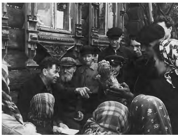
Суздальцы обсуждают начало войны.