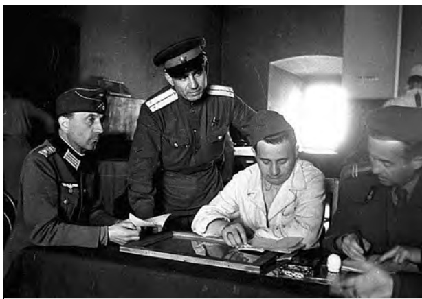
Военнопленные в Суздале.

Упомянем ещё один значимый эпизод в жизни военного Суздала – в начале войны в Спасо-Евфимиевом монастыре существовал фильтрационно-проверочный лагерь для военнослужащих Красной Армии, прошедших плен, а с начала 1943 г. по 1946 г. в монастыре действовал лагерь для военнопленных, в основном из офицерского состава. Лагерь являлся интернациональным: среди военнопленных были немцы, итальянцы, румыны, хорваты, австрийцы и даже испанцы. Некоторые из них (больше всего итальянцы) в связи с эпидемией тифа нашли последний приют на суздальской земле. Непродолжительное время после разгрома под Сталинградом в 1943 г. в лагере находился главнокомандующий 6-й немецкой армии фельдмаршал Паулюс со своим генералитетом. Некоторые бывшие военнопленные немцы и итальянцы уже в конце XX в. посещали Суздаль и место своего пребывания – Спасо-Евфимиев монастырь, ставший к тому времени уже крупнейшим музейным комплексом города. Надо сказать, что о своём пребывании в лагере и об отношении к ним, захватчикам, русского персонала и охраны они вспоминали с благодарностью, некоторые написали мемуары. Несмотря на тяжёлое для русского народа время, все военнопленные содержались в полном соответствии с международной Гаагской конвенцией о военнопленных, их кормили лучше, чем питались в то время советские люди. За три с половиной года через Суздальский лагерь № 160 прошло более 5000 военнопленных, в основном итальянцев.