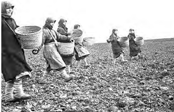
Сельскохозяйственные работы в Суздальском районе в годы войны.