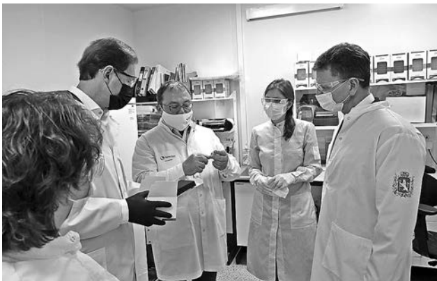
Д. Мантуров и В. Сипягин общаются со специалистами «Генериума».

Текущий объём производства по стране составляет более 500 тыс. изделий в сутки, и из них около 100 тыс. тестов методом ПЦР выпускают на заводе «Генериум». По состоянию на конец мая предприятие отгрузило более 1,5 млн экспресс-тестов в 64 региона России. Это первый отечественный инновационный экспресс-тест, который позволяет, используя стандартное оборудование, с точностью более 94 процентов определить наличие у пациента коронавируса в течение 40 минут. На сегодняшний день компания вышла на пик производственной мощности и готова производить до 3 млн тестов в месяц.