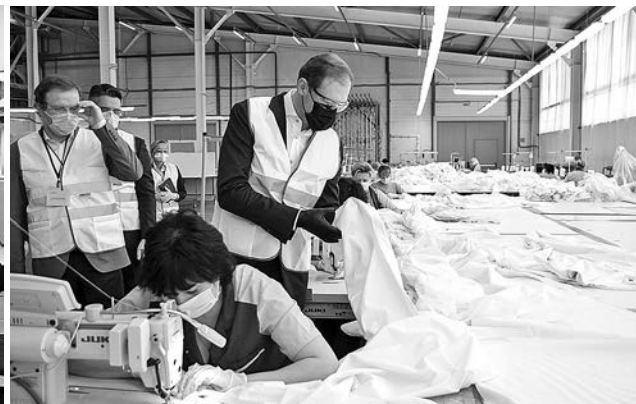
Д. Мантуров на производстве СИЗов в Коврове.

Также, Министр и губернатор посетили производство товаров для сна компании «Аскона» и осмотрели участок, переоборудованный в условиях распространения новой коронавирусной инфекции под производство средств индивидуальной защиты защитных масок и костюмов. С марта часть матрасного производства предприятия перепрофилирована на выпуск масок – до 200 тыс. штук в сутки и защитных одноразовых костюмов – до 6 тыс. штук в сутки. В