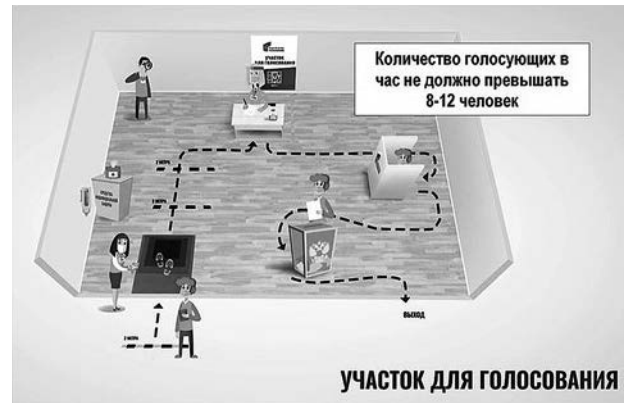
УЧАСТОК ДЛЯ ГОЛОСОВАНИЯ

Еще одна новая для российской избирательной системы процедура - голосование на придомовых территориях. Ею смогут воспользоваться участковые избирательные комиссии в течение шести дней голосования, то есть с 25 по 30 июня. В основной день