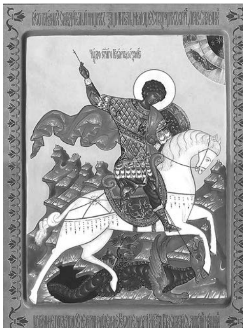
Икона Георгия Победоносца.

ООО «ЮТА-АвтоГаз» ОГРН 1095012001655 от 23.04.2009 г. Московская область, г. Балашиха, ул. Советская (Железнодорожный мкр.), дом 56. Реклама