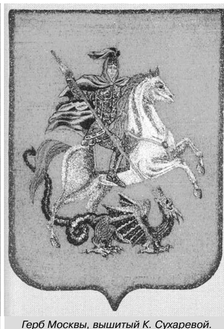
Герб Москвы, вышитый К. Сухаревой.