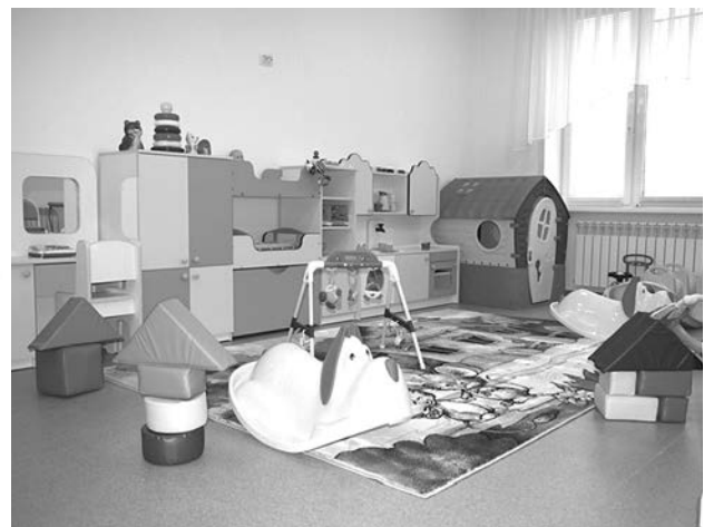
В новом детском саду детям наверняка все понравится.