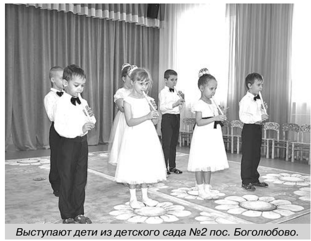
Выступают дети из детского сада №2 пос. Боголюбово.