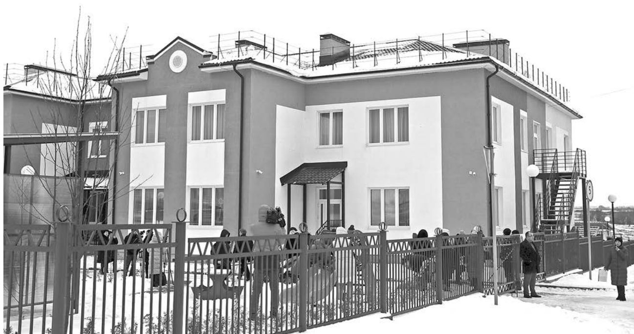
Новый детский сад «Радуга» в поселке Боголюбово.

В городе Суздале в районной библиотеке (ул. Ленина, 78) также состоится просмотр трансляции ежегодного Послания Президента России. Приходите, вы не только сможете послушать Послание, но и обсудить его. Начало трансляции в 12 часов.