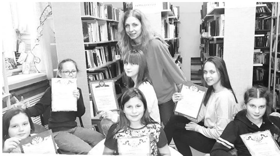
На мероприятиях в Сновицкой библиотеке