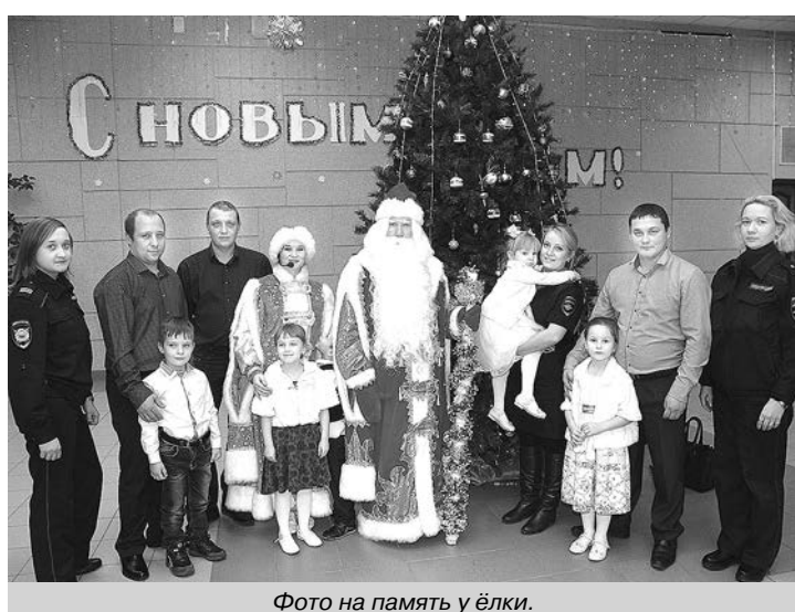
Фото на память у ёлки.

Посмотреть музыкальное сказочное представление, поводить хороводы у прекрасной ёлки вместе со сказочными героями, получить новогодние подарки съехались туда детвора со всей Суздальской земли. Мероприятие обслуживали стражи порядка ОМВД России по Суздальскому району из патрульно-постовой службы, отделения по делам несовершеннолетних, отдела участковых уполномоченных полиции, отдела ГИБДД (последние проконтролировали безопасное прибытие участников мероприятия и отправку детей по домам). Были участниками муниципальной ёлки и дети сотрудников ОМВД (соответствующего возраста), чьи родители