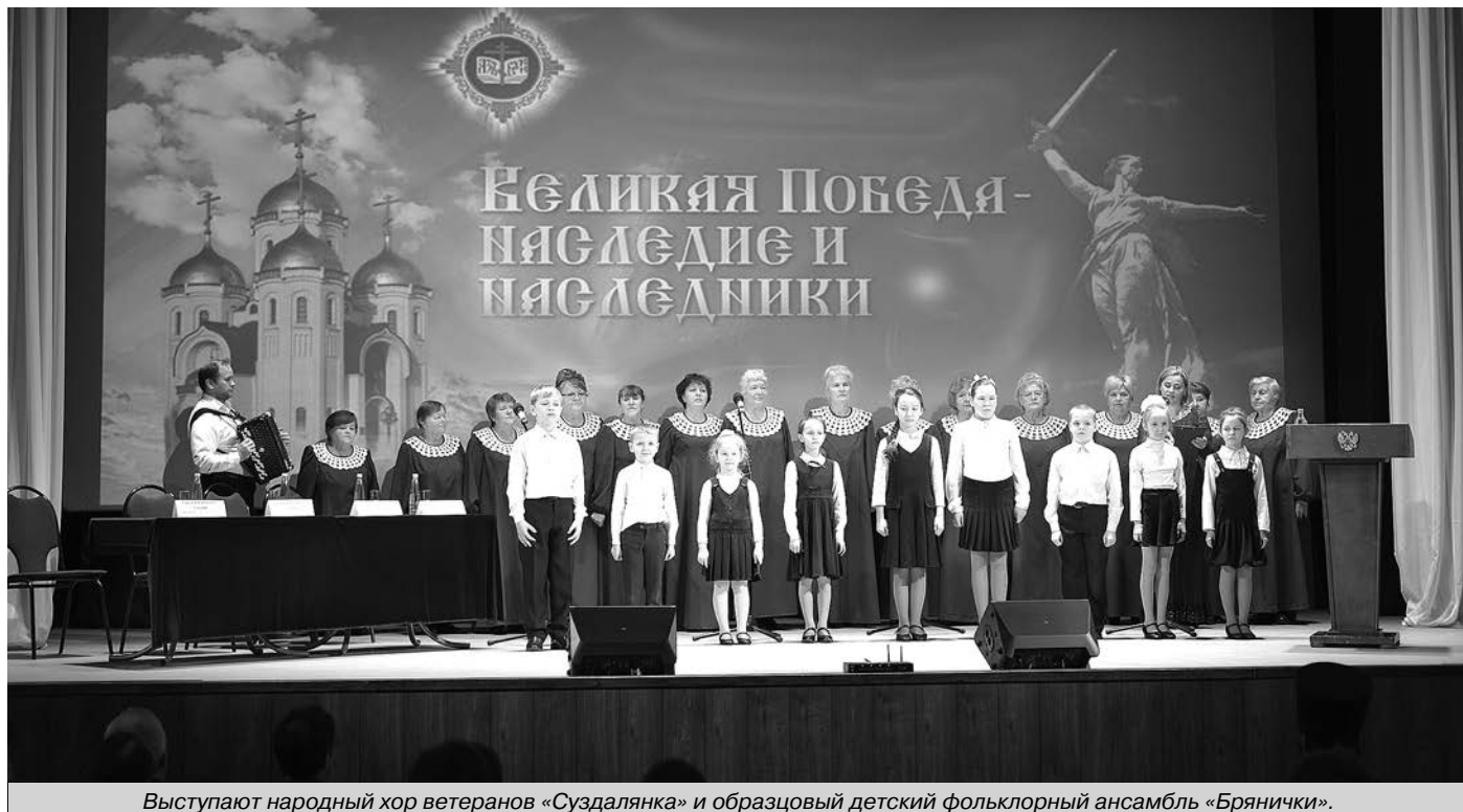
Выступают народный хор ветеранов «Суздалянка» и образцовый детский фольклорный ансамбль «Брянички».