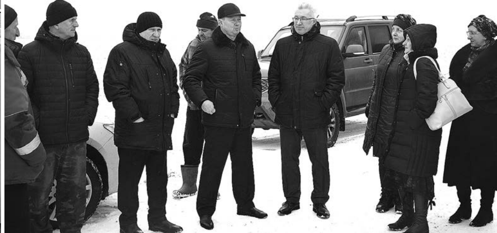
На встрече с жителями сёл, которые соединила новая дорога.