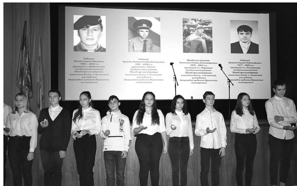
Школьники с зажженными свечами памяти.