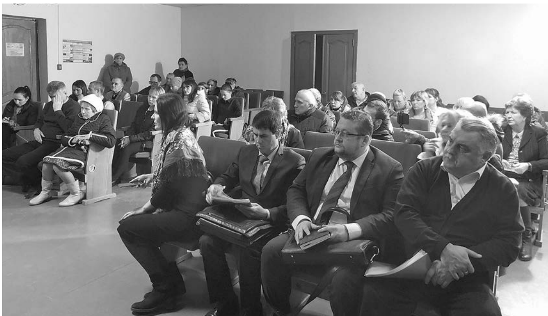
На встрече с населением в селе Сновицы.