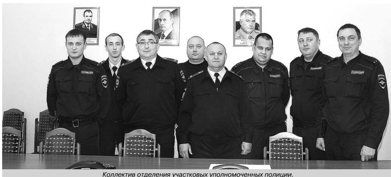
Коллектив отделения участковых уполномоченных полиции.