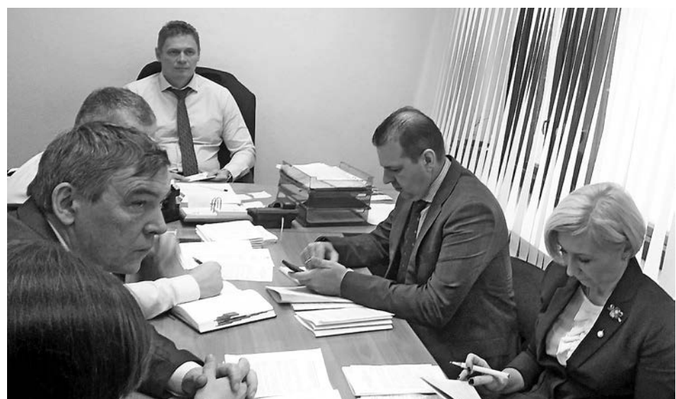
На заседании комитета ЗС по вопросам государственного устройства, правопорядка и законности.

И еще один «медицинский» вопрос сегодняшней повестки. Члены социального комитета поддержали инициативу фракции «Справедливая Россия» и высказались за то, чтобы поручить Счетной палате области проверить расходование средств на ремонт и модернизацию больницы в Струнино. Теперь слово за коллегами из бюджетного комитета и решением Заксобраний. Если большинство выскажется «за», будет принято постановление ЗС с соответствующей рекомендацией Счетной палате.