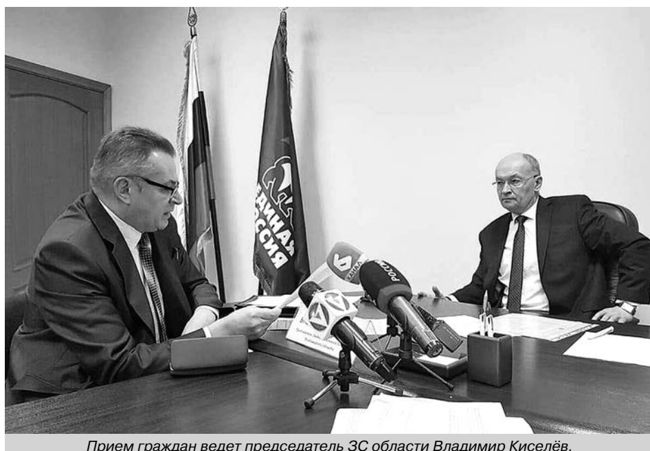
Прием граждан ведет председатель ЗС области Владимир Киселёв.