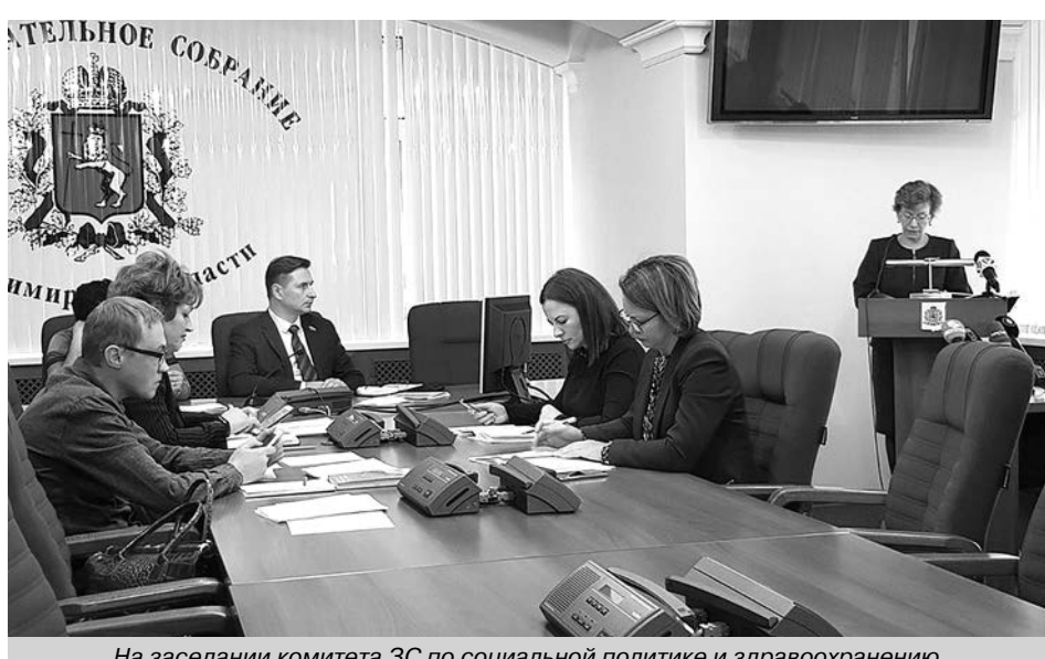
На заседании комитета ЗС по социальной политике и здравоохранению.