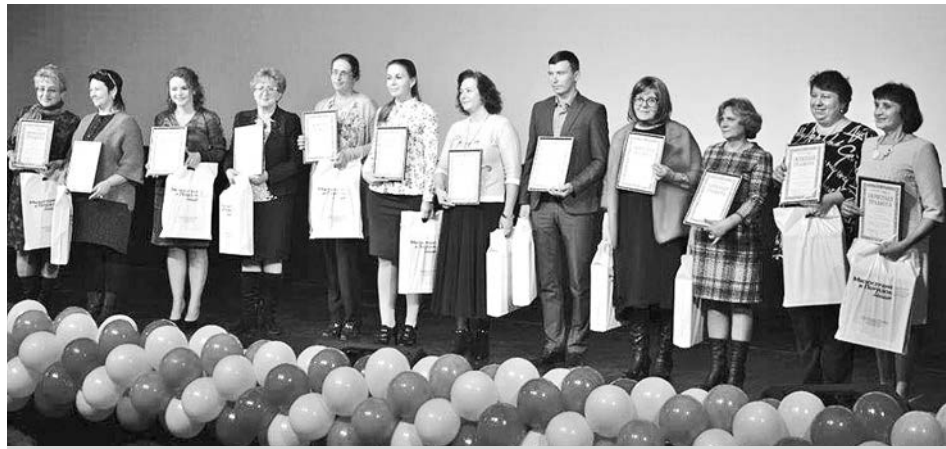
На торжественное мероприятие приехали более 250 педагогов из всех районов Владимирской области.