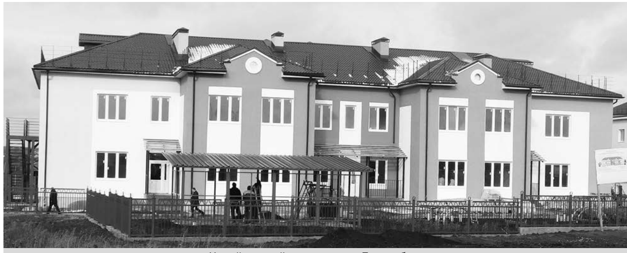
Новый детский сад в поселке Боголюбове.